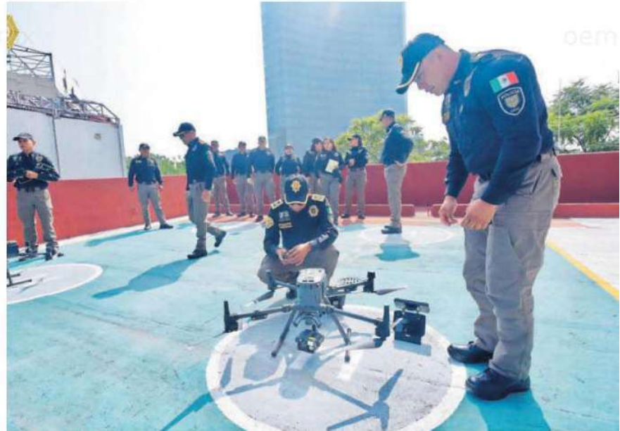
La Unidad de Inteligencia Aérea "Águila" cuenta con seis aeronaves pilotadas vía remota, las cuales tienen cámaras de alta definición

En el periodo que comprende del 01 de noviembre de 2022 al 21 de octubre de 2023, han realizado mil 470 operaciones en las 16 alcaldías de la Ciudad de México