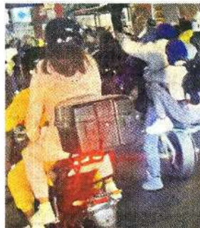
Ayer por la noche, en Periférico ya se hacían presentes las caravanas.