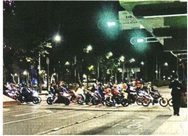
Las Rodadas del Terror sumaron ya tres días de bloqueos en vialidades y violaciones al Reglamento.

Para evadir a la Policía, para estas nuevas fechas, los organizadores evitaron informar posibles rutas y metas.