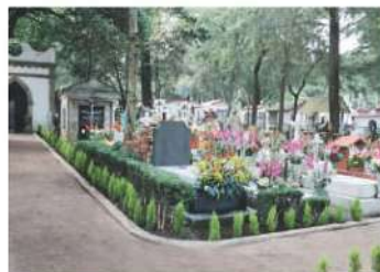
Se realizan patrullajes constantes para prevenir incidentes. Especial