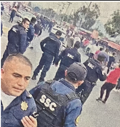
■ El zafarrancho se registró en la Colonia Chinampac de Juárez, Iztapalapa.