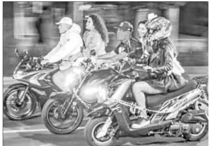
► Las remisiones fueron por violar el Reglamento de Tránsito.

Otros despliegues de uniformados fueron en Paseo de la Reforma, en la Puerta de los Leones, la Glorieta de la Diana Cazadora y el Ángel de la Independencia.