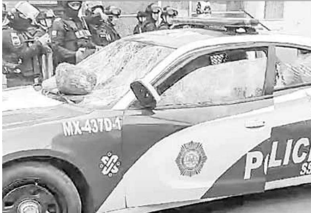
▲ Al menos cuatro patrullas resultaron dañadas por un grupo de habitantes de campamentos de la colonia Chinampac de Juárez en la alcaldía Iztapalapa; las unidades quedaron con cristales rotos y afectaciones en la carrocería.