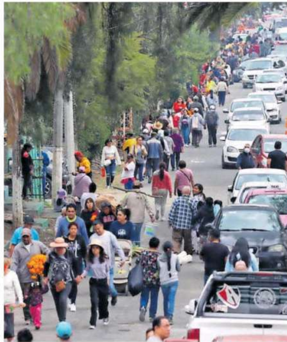
Con despliegue de operativo de seguridad, Iztapalapa reportó saldo blanco en sus Panteones /IGNACIO HUITZIL