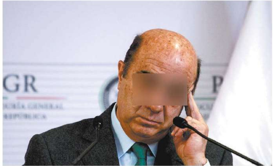
➦ Es el creador de la llamada "verdad histórica" sobre los 43.