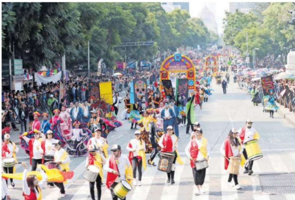
Aspectos de la procesión comunitaria de día de muerto de la puerta de los leones /DAVID DEOLARTE