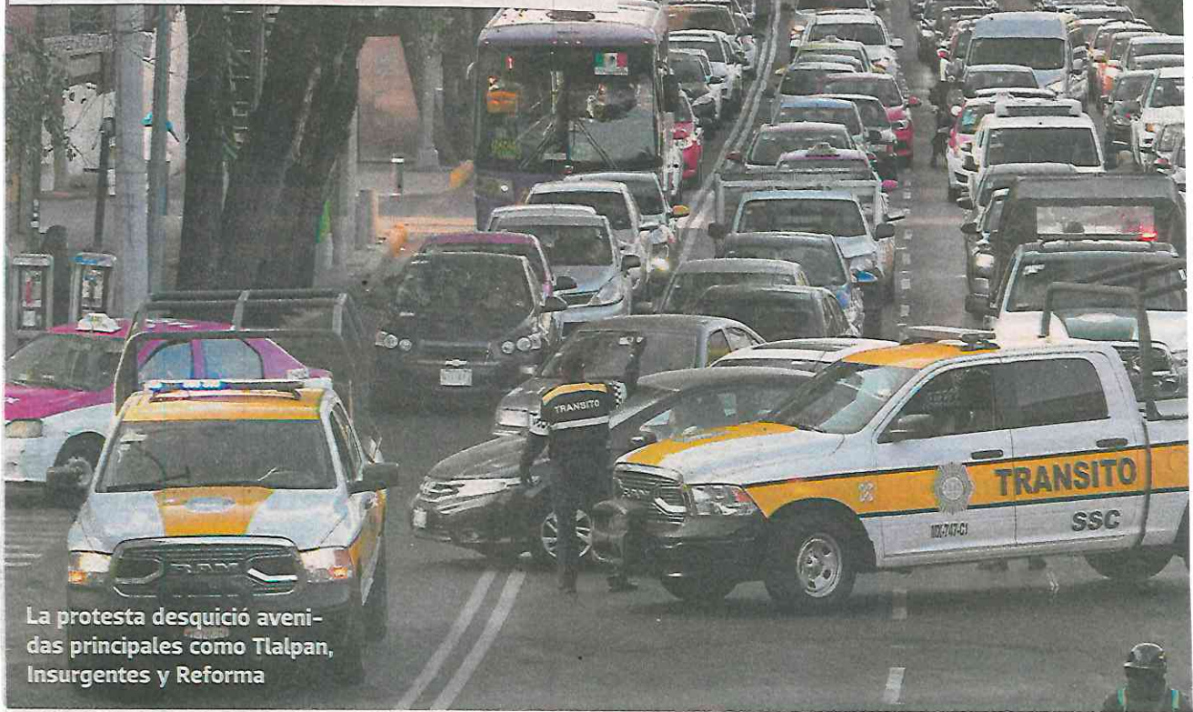
La protesta desquició avenidas principales como Tlalpan, Insurgentes y Reforma