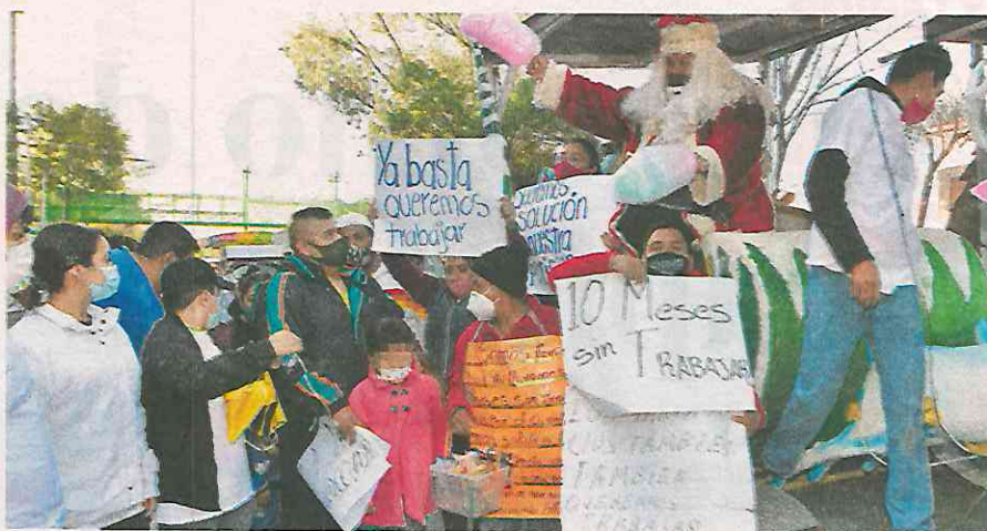
Uno de los contingentes que protestó ayer en la CDMX fue el de los ferieros, que ya quieren regresar a trabajar

"Demandamos el reconocimiento del presupuesto, no atentar contra el cierre de planteles como lo que estamos viviendo hoy en el estado de Chiapas, están cerrando más de 100 planteles dejando a más de 1,500 estudiantes de las comunidades más