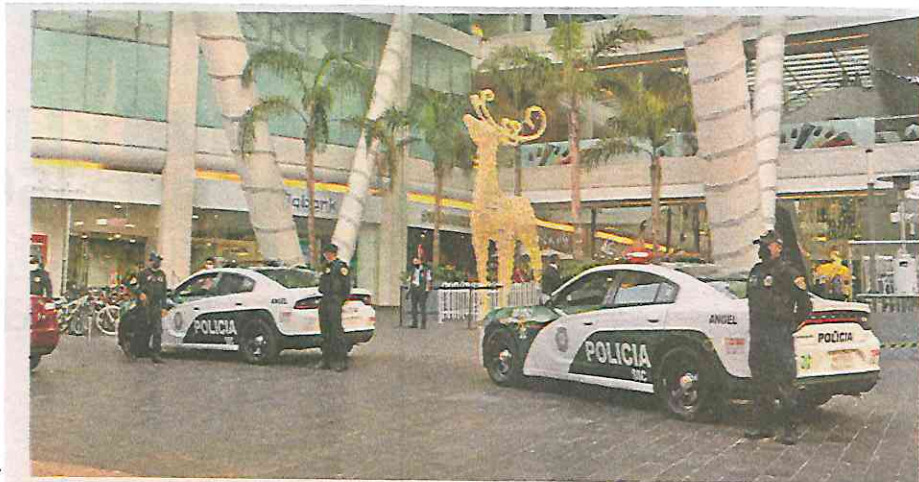
Labores en beneficio del patrimonio del trabajador

dad de la población y, en su caso, detener a aquellos que cometan algún ilícito e iniciar las investigaciones correspondientes.