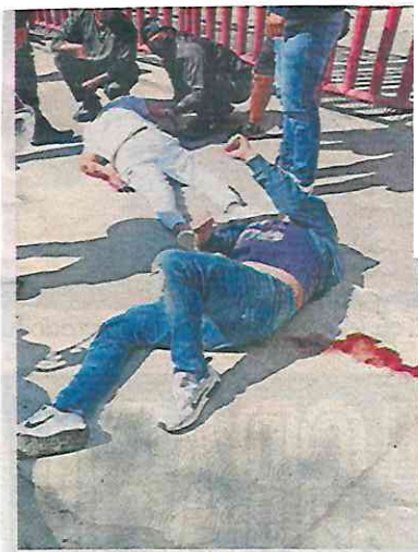
El líder de la Ruta 20 y su chalán.