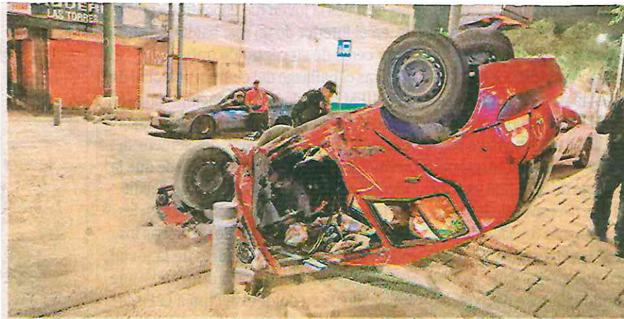
Vehículo embestido por un taxi que iba a exceso de velocidad