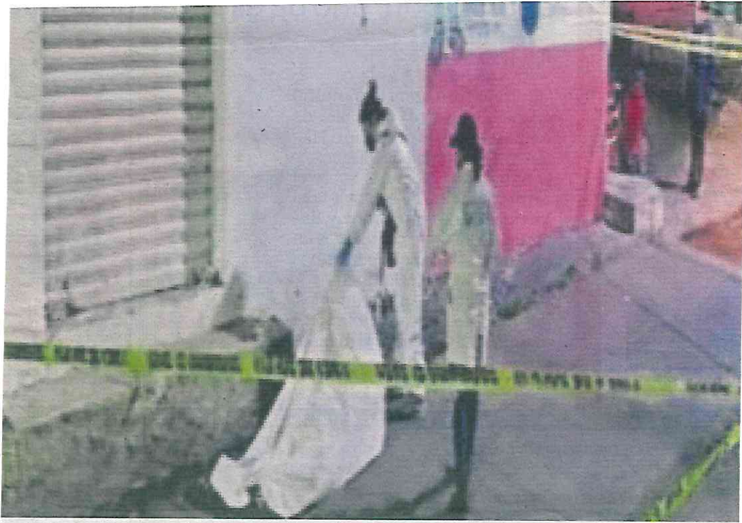
Jesús fue asesinado por 'motosicarios' en calles del Barrio El Mirador, en la Alcaldía Xochimilco.