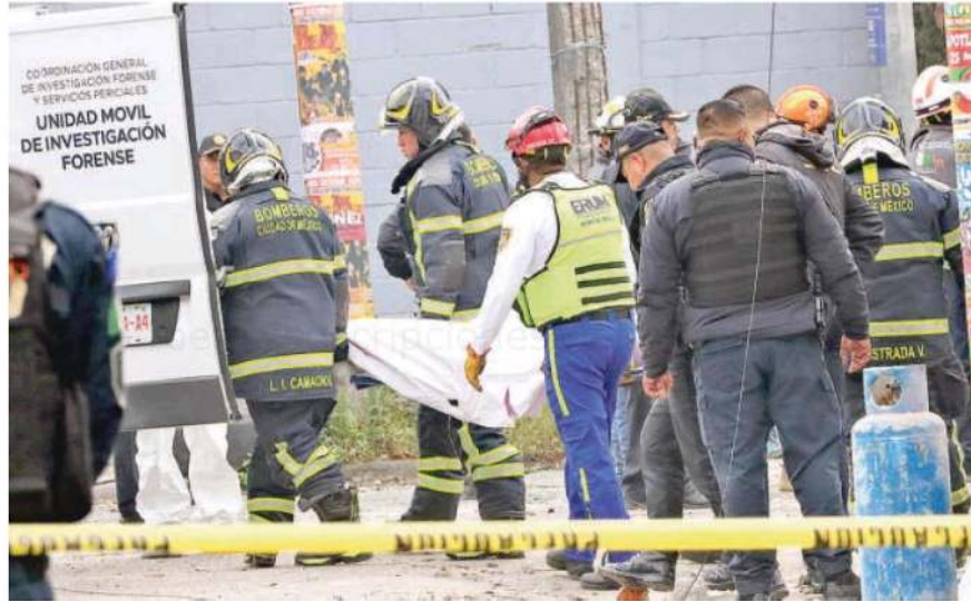
Una lluvia de ladrillos junto con pedazos de metal, vidrios y concreto, alcanzó al hombre que esperaba un taxi de aplicación