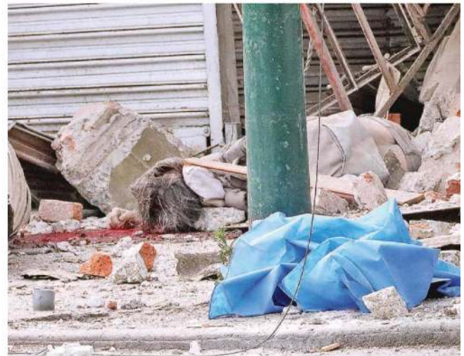
La explosión en la bodega ocurrió aproximadamente a las 05:00 horas de ayer en la colonia Industrial Vallejo; a la derecha, una de las víctimas mortales