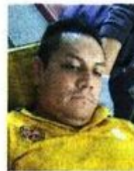
El estudiante de criminología fue trasladado al hospital.