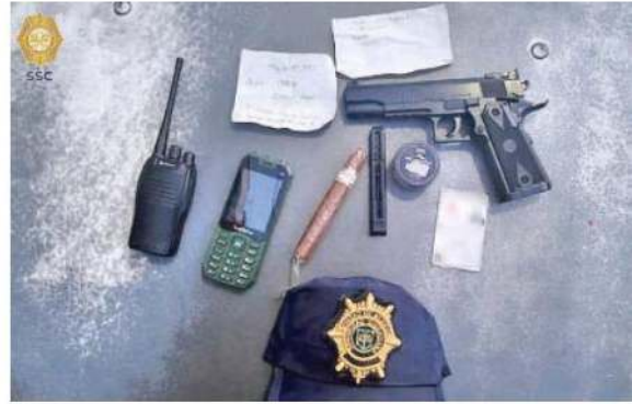
Al ser detenido, el falso policía portaba un uniforme y artículos con insignia de la SSC, sin poder identificarse como oficial activo