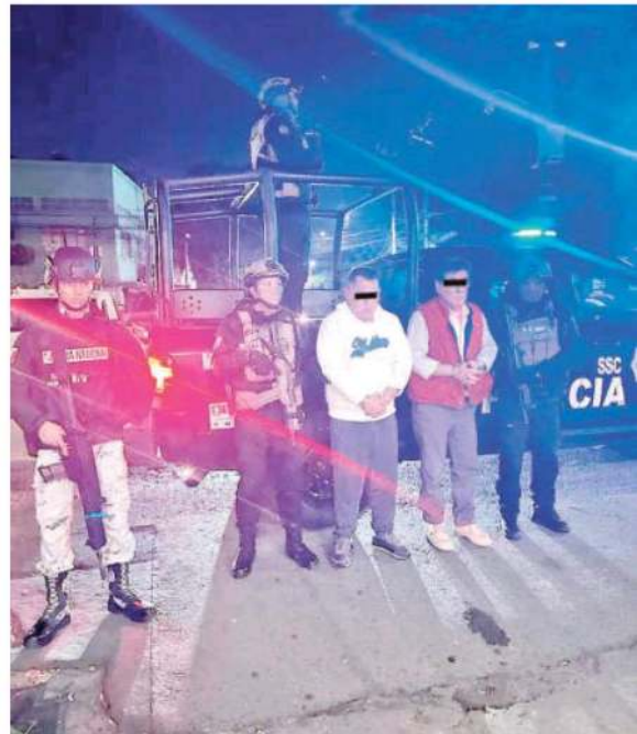
A los detenidos se les vincula con extorsión y narcomenudeo

Los detenidos fueron presentados ante el Ministerio Público correspondiente, en donde se inició una carpeta de investigación en su contra por delitos mencionados. En las próximas horas, se definirá su situación legal.