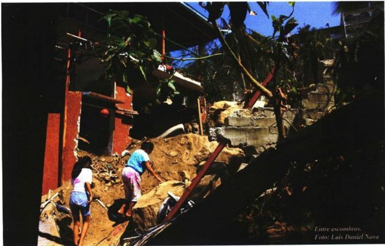
Entre escombros.

En la búsqueda por mar se integró el Escuadrón de Rescate y Urgencias Médicas (ERUM) de la Secretaría de Seguridad de la Ciudad de México. Personal de la Fiscalía local ha visitado a familiares de las víctimas para decirles que continúan con las investigaciones. Pero nadie sabe más.