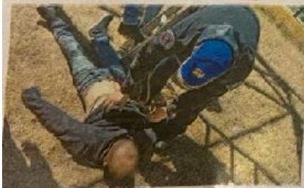
Explicó tomó la fatal determinación por un problema de parejas

Posteriormente llegó una mujer que se identificó como la esposa de la persona rescatada y refirió que se haría cargo de él.