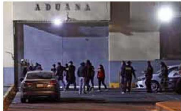
Jurisdicción. Se han trasladado 200 reos a penales federales durante la administración de Sheinbaum.

Cabe destacar que estos lujos no sólo se han visto en la CDMX. En otros estados, como Nuevo León, el penal de Topo Chico, cuando aún estaba abierto –en 2016– se dieron a conocer imágenes de las celdas. Tras un cateo, se decomisaron cientos de artículos, entre ellos: electrodomésticos, televisores, baños sauna, un bar, entre otros objetos prohibidos para los reos.