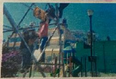
Con un alambre atado al cuello saltó al vacío, pero lo sujetaron