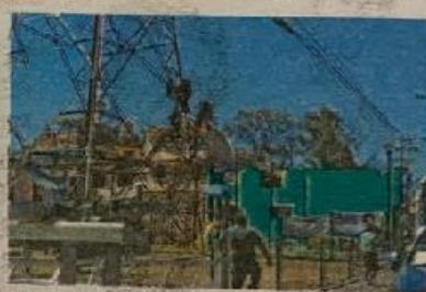
Hablaron con él, pero éste no los quería escuchar