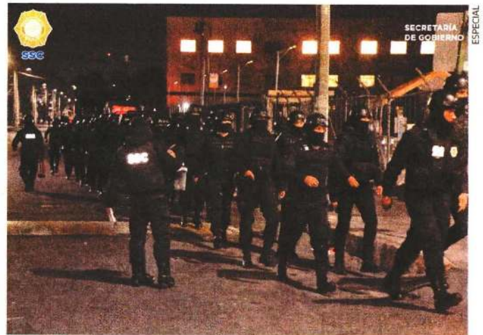
Con 411 elementos de la policía capitalina, la Secretaría de Seguridad Ciudadana realizó los operativos en los reclusorios Sur y Oriente.

La Secretaría de Gobierno informó que después de los operativos no se realizó ningún traslado de reos, aunque fuentes señalaron que el lunes por la tarde se realizaron seis traslados con dirección a la zona Diamante, los módulos de alta seguridad, y a los Centros Varoniles de Seguridad Penitenciaria. ●