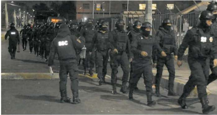
En los operativos en dos reclusorios participaron 411 policías de la SSC, además de los elementos de custodia

EN LOS operativos en los reclusorios Sur y Oriente se decomisaron teléfonos celulares, utensilios punzo cortantes, paquetes de cigarrillos, aparatos eléctricos y dinero en efectivo