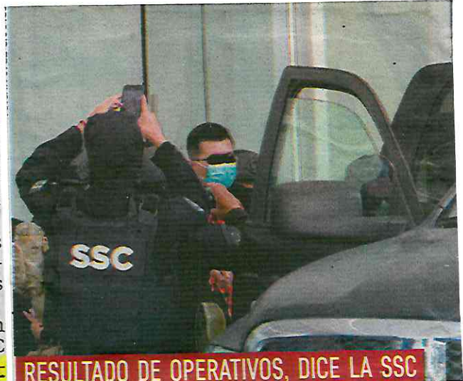
RESULTADO DE OPERATIVOS, DICE LA SSC

PUNTOS porcentuales incrementó la confianza en la policía capitalina, señalaron las autoridades locales.