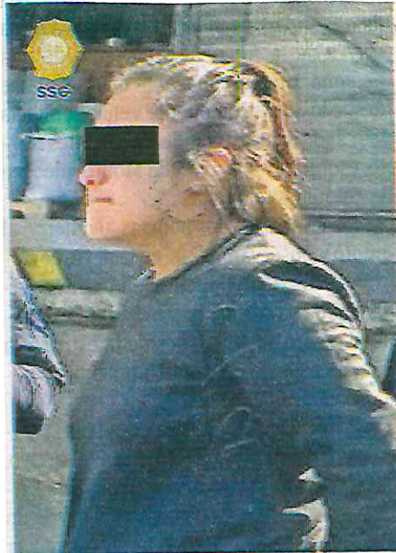
Policías detuvieron a una mujer de 20 años de edad, posible responsable de sustraer dinero de una caja fuerte

Los oficiales identificaron a la persona que aparecía en los videos y se percataron que la posible responsable se encontraba en el lugar.