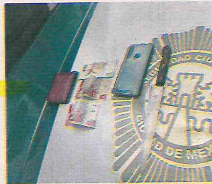
Hombre despoja a joven de un dispositivo móvil y una cartera

Enseguida los oficiales solicitaron el apoyo médico, al lugar acudieron paramédicos de Protección Civil (PC) quienes atendieron al afectado a quien diagnosticaron con una herida punzocortante en