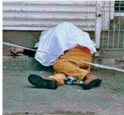
Al lugar acudieron paramédicos que descartaron huellas de violencia en el cuerpo del hombre

Las investigaciones continuaron en el sitio con el fin de esclarecer las causas del fallecimiento, mientras los servicios de emergencia concluyeron sus labores en esta concurrida zona comercial del Centro de la Ciudad de México.