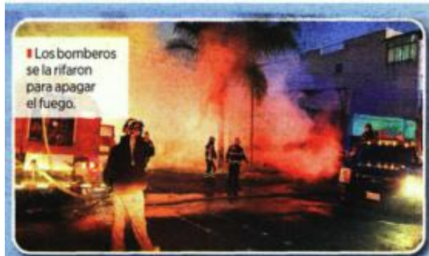
Los bomberos se la rifaron para apagar el fuego.