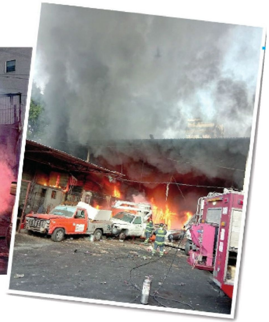
Bomberos laboraron horas extrass