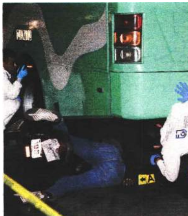
El motociclista murió bajo las llantas traseras del camión de pasajeros.

En tanto, los detectives ministeriales revisan las cámaras de seguridad en la zona para determinar cómo ocurrió el accidente.