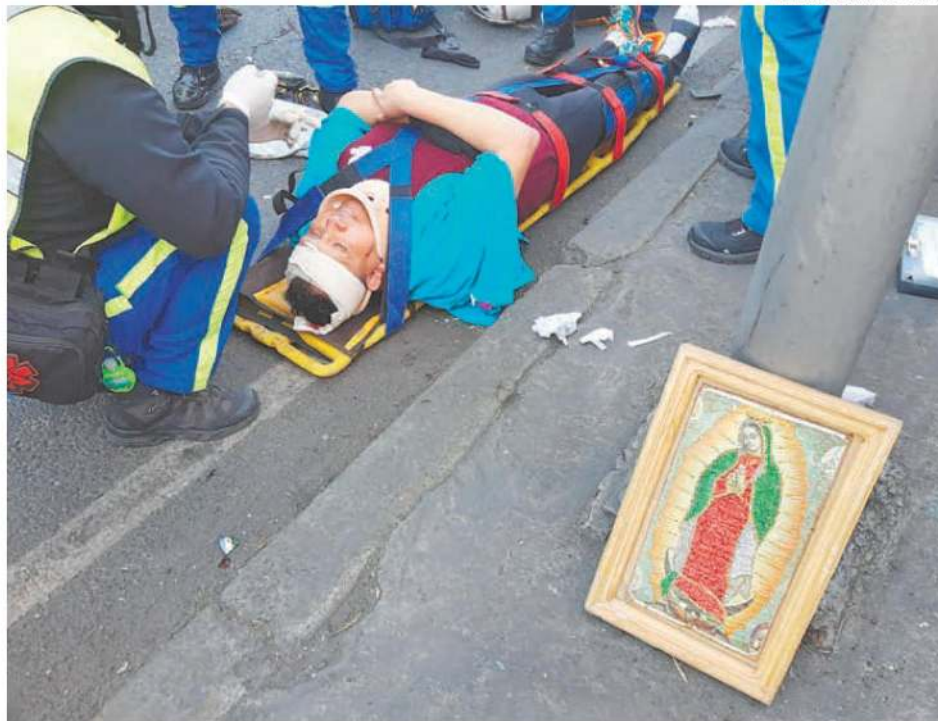
En el cuarto trimestre de 2021 hubo 594 ciclistas heridos en hechos de tránsito