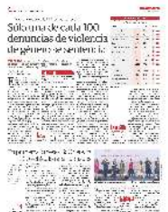
AUTORIDADES capitalinas en la presentación del Programa de Chatarrización, ayer.