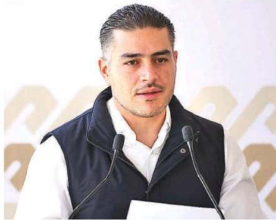
El secretario García Harfuch en la presentación del Programa de Chatarrización 2023