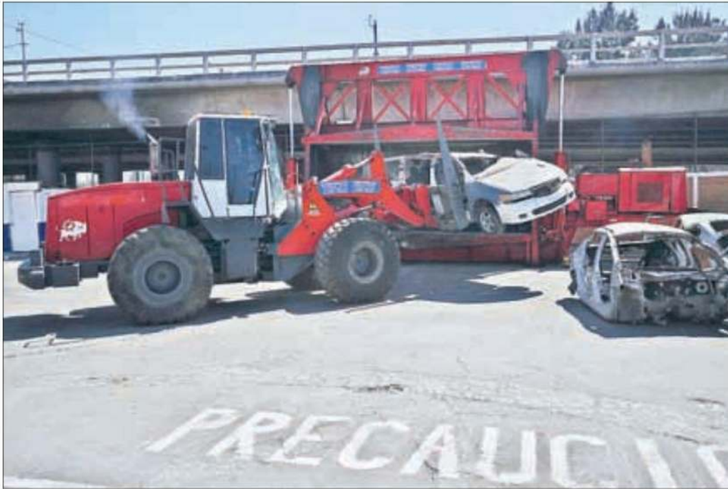
▲ Ante autoridades federales y capitalinas, se destruyeron vehículos destartalados, que en muchas ocasiones son usados por hampones.