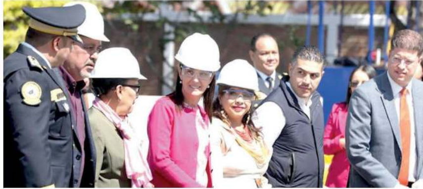
· Testifican el proceso de chatarrización