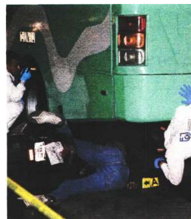
El motociclista murió bajo las llantas traseras del camión de pasajeros.

En tanto, los detectives ministeriales revisan las cámaras de seguridad en la zona para determinar cómo ocurrió el accidente.