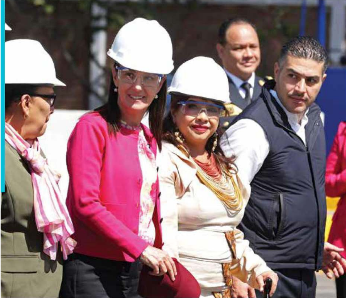
PROGRAMA. Rosa Icela Rodríguez, Claudia Sheinbaum, Clara Brugada y Omar García Harfuch, ayer, en Iztapalapa