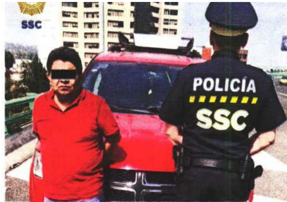
Los hampones caen más por infracciones de tránsito.

Aseguró que en 11 meses se ha fortalecido, en casi 30 por ciento, el estado de fuerza de la subsecretaría.