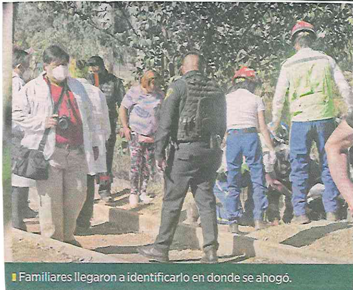
■ Familiares llegaron a identificarlo en donde se ahogó.