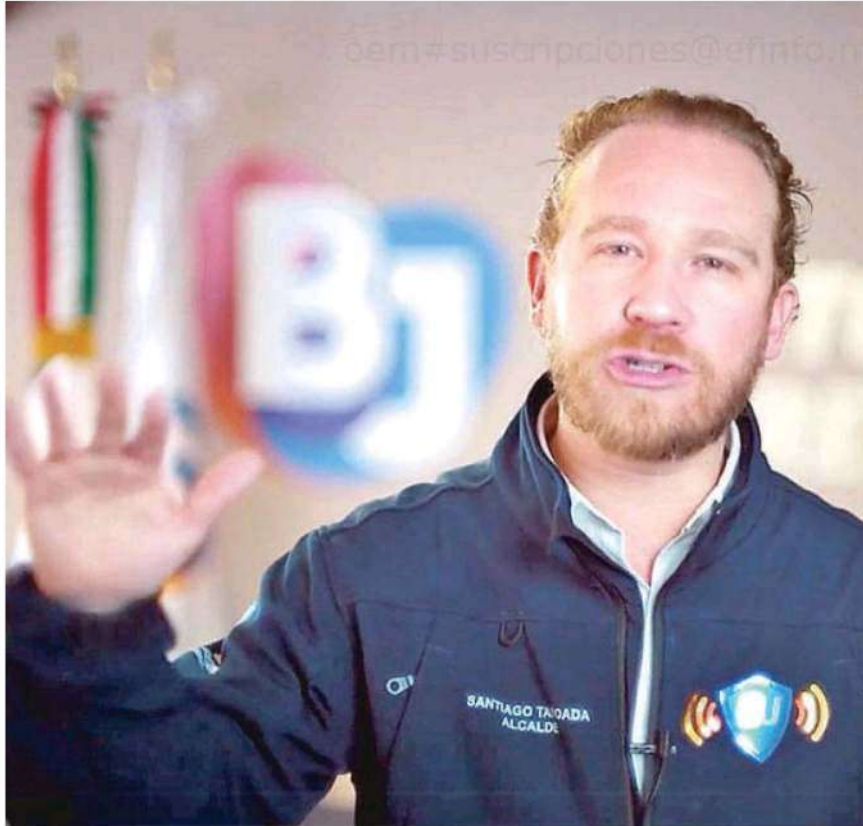
Santiago Taboada , alcalde de Benito Juárez