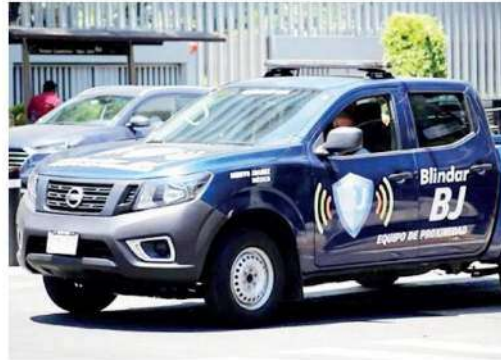
Sus patrullas son hechizas; del PAN tenía que ser

“En ningún momento se pidió detener el programa Blindar, no es ordenamiento de la Fiscalía”, se destaca en el documento. Finalmente, la FGJCDMX enfatizó que la diligencia de verificación concluirá a la brevedad, pues al momento se ha realizado la inspección de 19 patrullas, 3 ambulancias y 10 de 24 motos reportadas por la alcaldía.