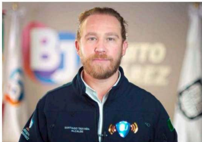
Santiago Taboada acusó a la jefa de Gobierno.