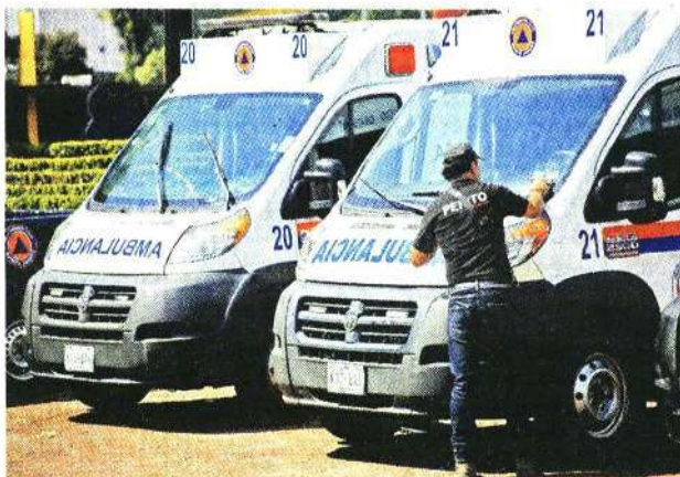
■ Los servicios urbanos y de seguridad pública quedaron en pausa durante dos horas en la B.J.