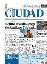
⊕ Ernestina Godoy Ra- mos, titular de la FGJ.