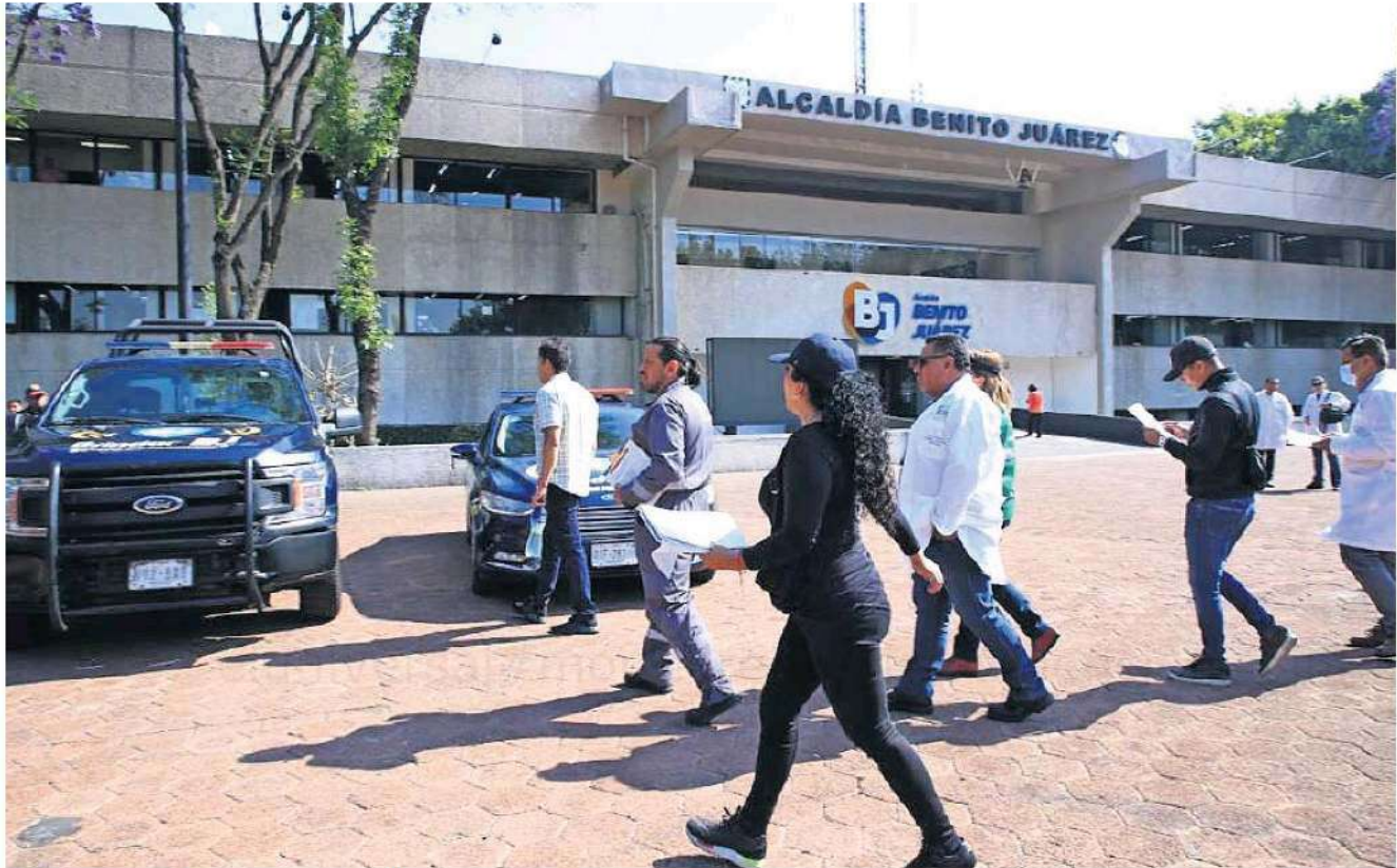
La alcaldía Benito Juárez acusó que la diligencia se prolongó más de tres horas y los peritos no dieron los nombres de quienes participaron.