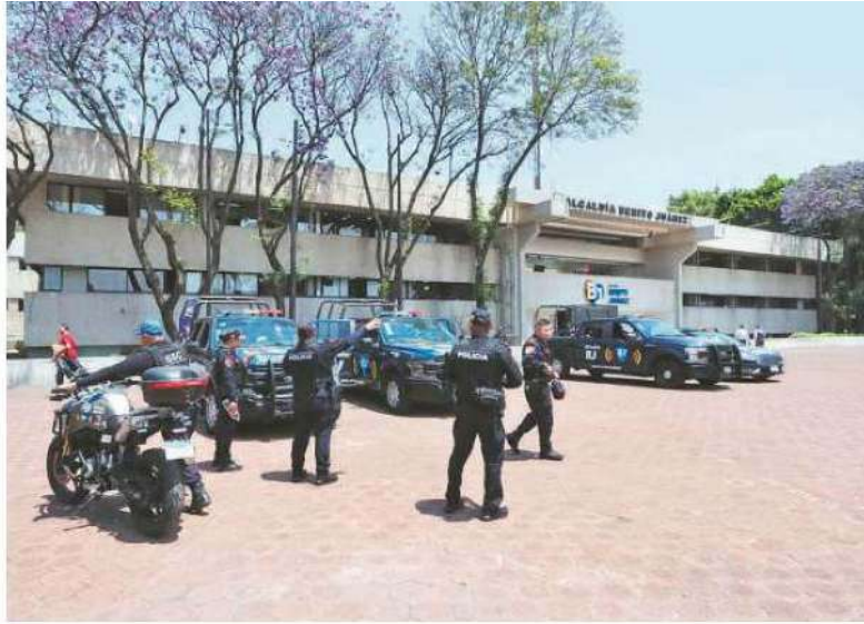
El operativo de revisión concluyó luego de tres horas