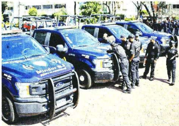
■ La Alcaldía detalló que recibió la orden de presentar todos los vehículos adquiridos desde 2018.