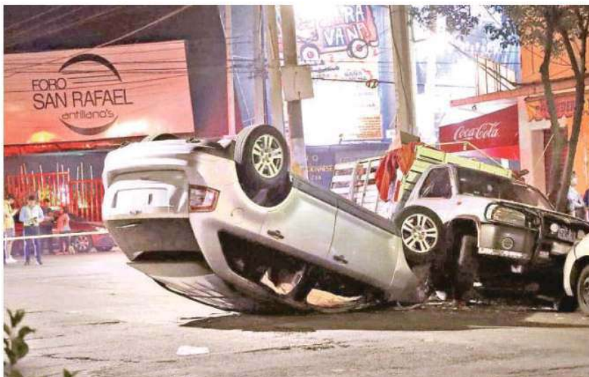
Llantas arriba quedó este auto luego que su conductor fuera baleado en calles de la Colonia San Rafael