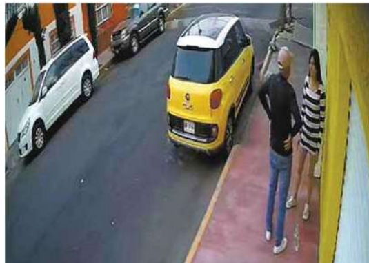
⊕ Los hechos ocurrieron el domingo pasado por la tarde en calles de la alcaldía Venustiano Carranza.

Y es que con base en la grabación que circula en redes sociales, se muestra a una fémina con vestido a rayas que iba caminando y platicando junto a un sujeto que viste playera de manga larga negra, quien casi de inmediato le cierra el paso a la mujer al poner su brazo detrás de ella y luego la sube a un carro gris.