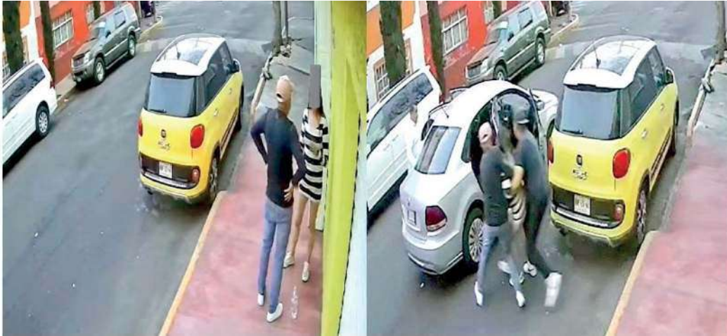
Los hechos provocaron temor en habitantes de la zona