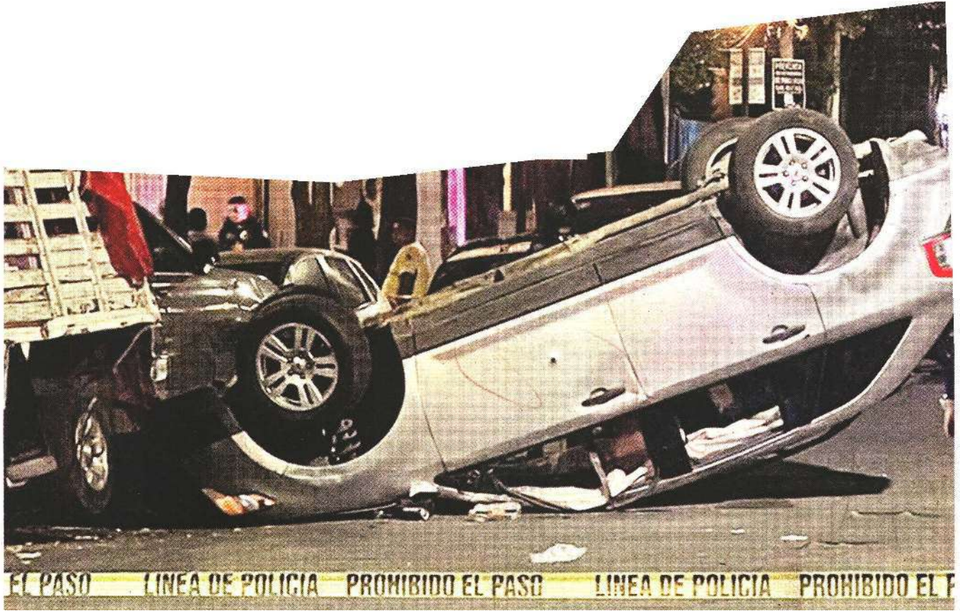
El coche volcó en la Colonia San Rafael.