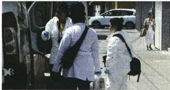
La víctima es un hombre de unos 60 años, el cuerpo no tenía huellas de violencia y se desconoce si iba acompañado.