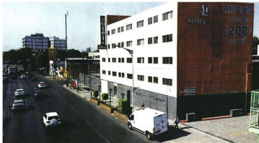
COYOACÁN. El hotel donde falleció el huésped se ubica sobre Calzada de Tlalpan.