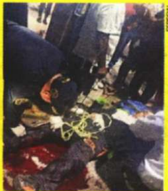
El sitio de la agresión es de los más inseguros de Iztapalapa.