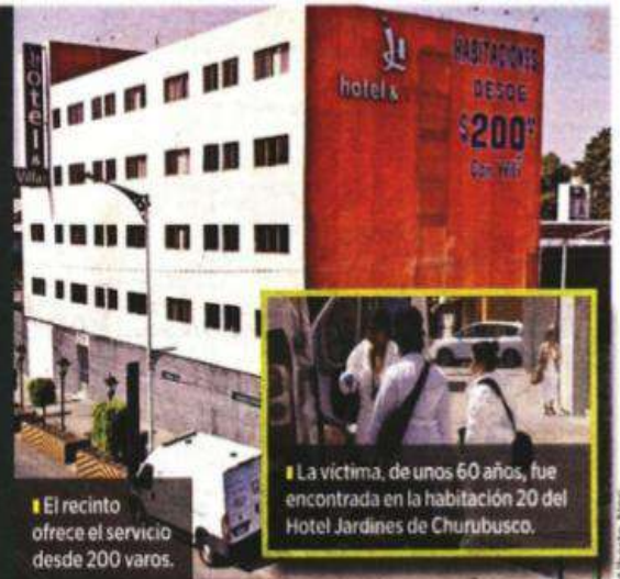
El recinto ofrece el servicio desde 200 varos.

Pese a la demora del personal de la Fiscalía capitalina, nadie acu-