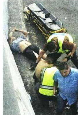
El conductor y su copiloto quedaron lesionados en el Eje 1 Norte.

Cuando terminaron las maniobras, el líquido que aún tenía el contenedor terminó por caer hacia el asfalto.