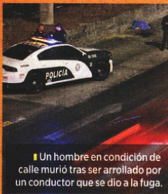
■ Un hombre en condición de calle murió tras ser arrollado por un conductor que se dio a la fuga.