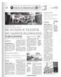
Los sicarios lo andaban cazando