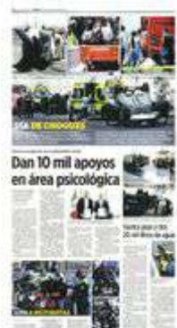
En plena temporada de estiaje y de escasez de agua, 20 mil litros del líquido se desperdiciaron al volcar una pipa.