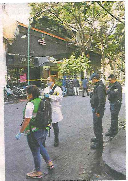
Se registró una balacera en el antro ubicado en la calle Londres y el andador Génova, colonia Juárez; el saldo, dos personas lesionadas