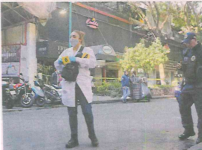
■ El bar en Calle Londres, en la Colonia Juárez, quedó bajo resguardo policial y peritos realizaron diligencias.