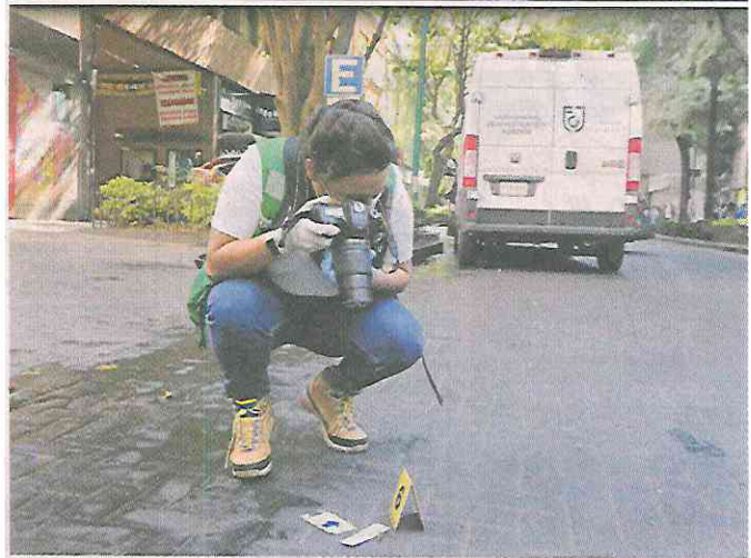
■ Durante la madrugada de ayer, una pelea dentro de un bar en Zona Rosa dejó dos hombres lesionados, de 37 y 25 años.