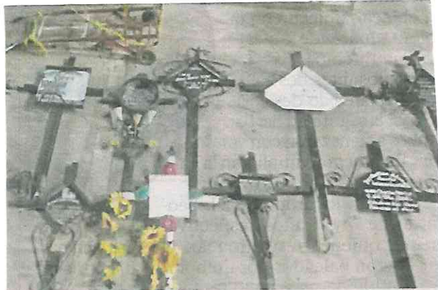
Los hombres ya se llevaban el botín con unos diablitos.

Con estas evidencias, los policías detuvieron y trasladaron a los hombres de 60 y 36 años, a la agencia del Ministerio Público, donde se determinaría su situación jurídica.