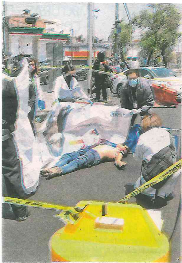
Hombre en situa- ción de calle mue- re atropel- lado en Calle 77 y calzada Ignacio Zaragoza, colonia Puebla