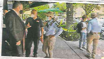
La respuesta inmediata es crucial en casos de urgencia

Los oficiales recorrieron las calles Anatole France, Oscar Wilde, Julio Verne, Alejandro Dumas y Emilio Castelar,