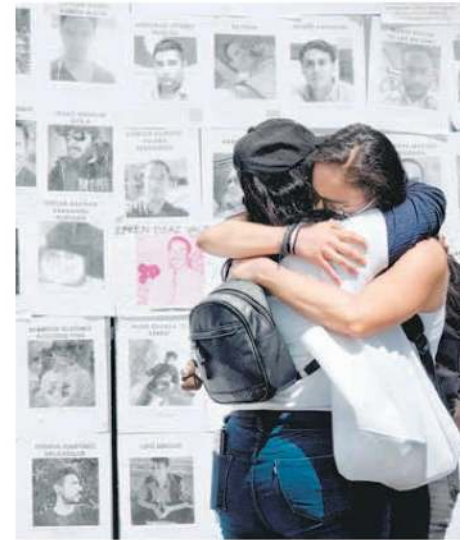
En 2022 hubo más de 37 mil casos