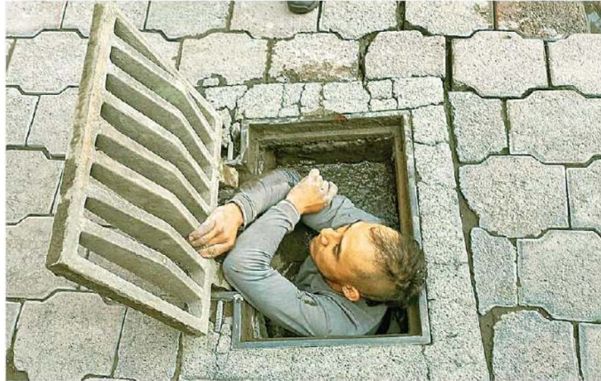
El joven , quien dijo dedicarse a la construcción, permanecía con rostro de desesperación recargando sus brazos en el contorno del drenaje