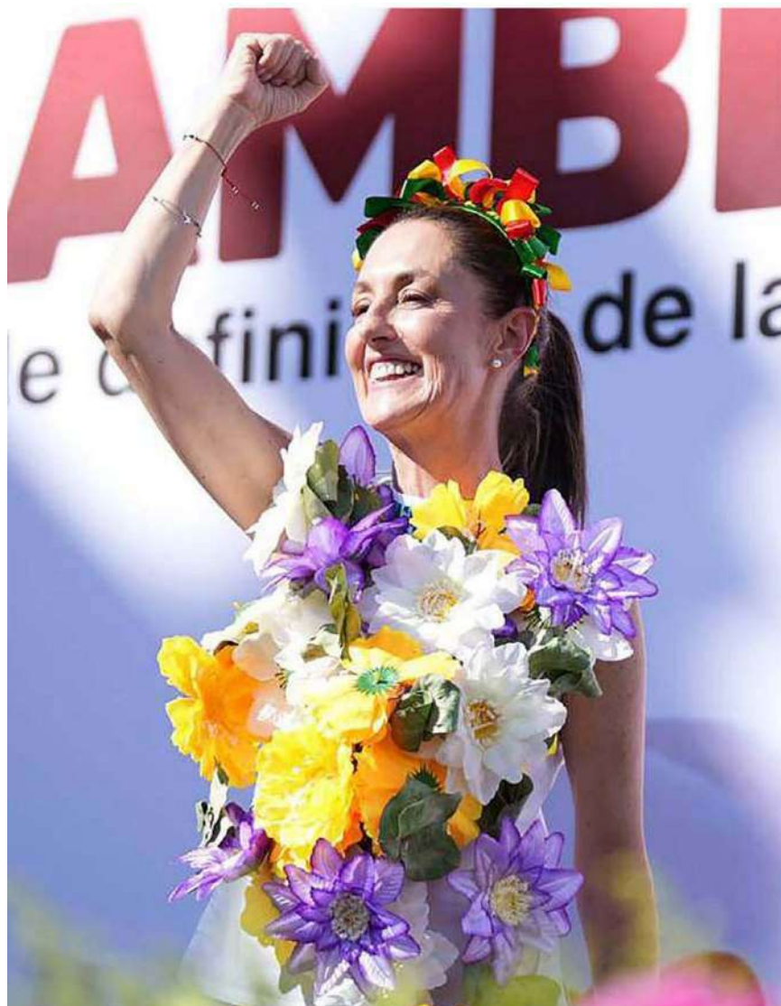
Claudia Sheinbaum, aspirante a la candidatura presidencial de Morena.

En materia de cultura, la Unión de Ciudades Capitales Iberoamericanas (UCCI) otorgó a la Ciudad de México la distinción Capital Iberoamericana de las Culturas para 2021; mismo año en que se le otorgó el reconocimiento en la Base de Datos Global Buenas Prácticas Culturales, otorgado por la Red Ciudades y Gobiernos Locales Unidos, por hacer de la cultura el cuarto pilar del desarrollo sostenible a través de los Puntos de Innovación, Libertad, Artes, Educación y Saberes (PILARES) ●