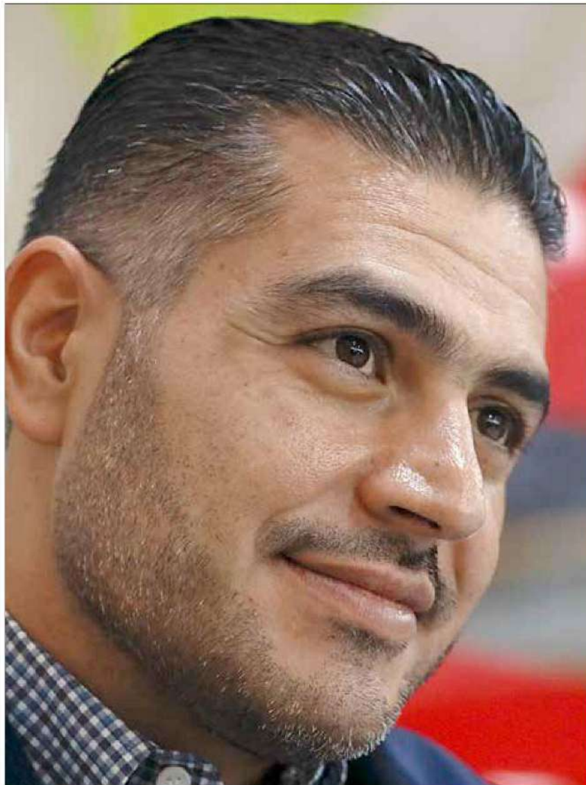
▲ Omar García Harfuch, titular de la SSC-CDMX, en la entrevista con La Jornada.

● “En las tareas de seguridad en la capital no pueden permitirse distracciones”