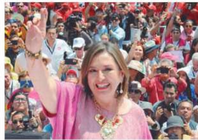
Gobierno de la CDMX asegura que solo asistieron 4 mil personas.

Seguidores de la Cuarta Transformación usaron las tomas en tiempo real de Webcams de México para evidenciar la poca asistencia. Y a ello se le sumó los videos y fotografías subidos por reporteros donde se podía ver la poca nutrida asistencia. ●