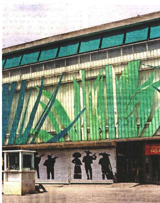
Las investigaciones apuntan que utilizan adolescentes para cometer ilícitos en la Plaza Garibaldi y colonias como la Guerrero.