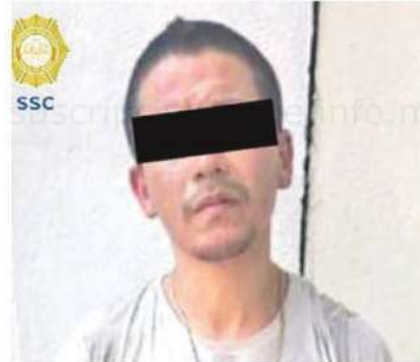
El posible implicado portaba una mochila con objetos que probablemente sustrajo del lugar

Cabe mencionar que, tras hacer un cruce de información, se pudo saber que el detenido cuenta con una presentación ante el Juez Cívico en el año 2020 por impedir el libre tránsito de las personas y en el año en curso una presentación ante el agente del Ministerio Público por Robo de objetos.