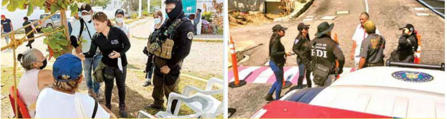
Elementos de la Fiscalía General de Justicia de la Ciudad de México coordinan actividades con la Fiscalía General de Justicia de Guerrero.