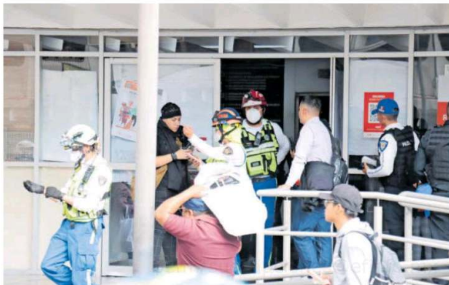
Tras rescatar al trabajador accidentado fue trasladado a un hospital