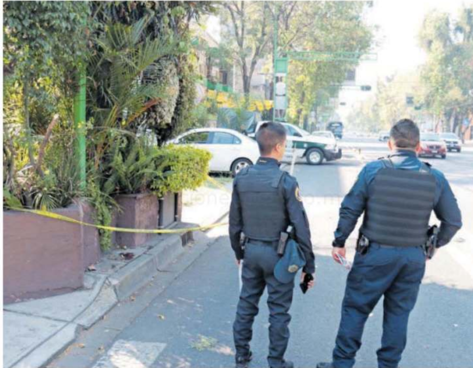
Bajo resguardo del personal de la Secretaría de Seguridad Ciudadana (SSC) quedó el feto en la vía pública, en espera de los peritos