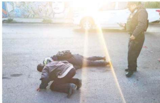
Integrantes del área pericial y Forense llegaron al lugar para el levantamiento del cadáver