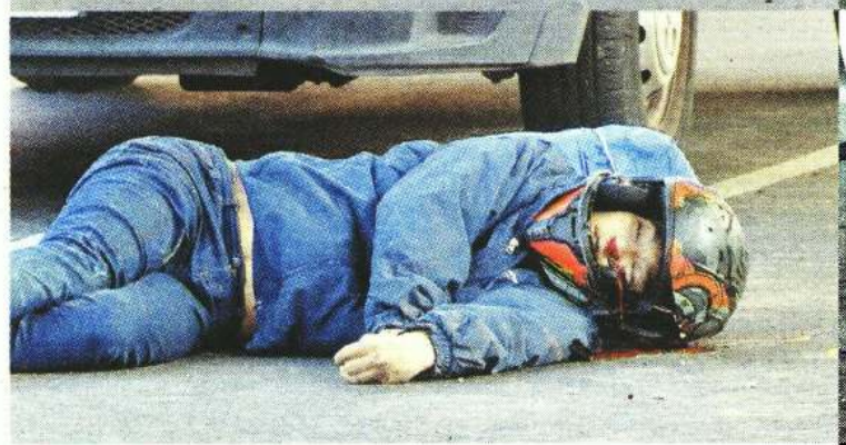
JUEVES Un joven de 23 años falleció tras derrapar en su moto sobre Avenida Luis Cabrera, en Magdalena Contreras.