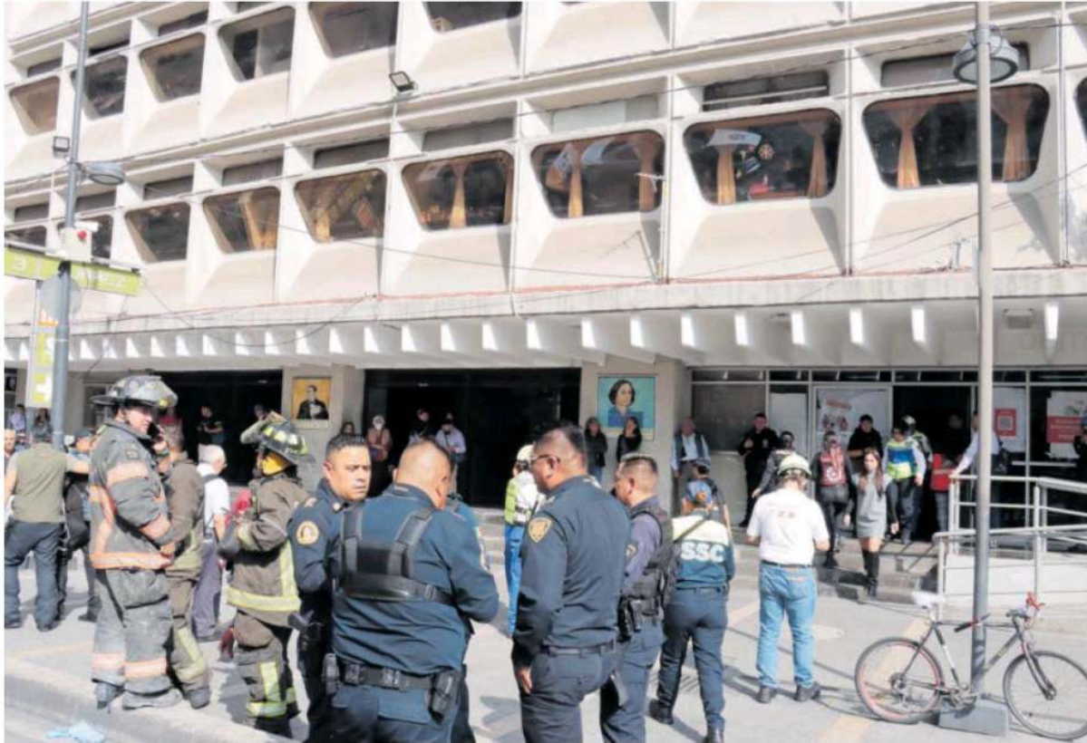
Fue después de las 14:00 horas cuando los servicios de emergencia recibieron el llamado de auxilio para ayudar a un trabajador que se encontraba realizando labores en un elevador