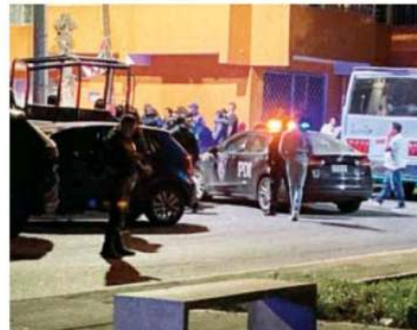
Al parecer los agresores iban en moto y lograron escapar

Aproximadamente a las 19:00 horas, integrantes del área pericial y Forense de la Fiscalía capitalina, llegaron a dicho lugar para realizar el levantamiento del cadáver.