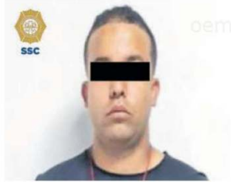
A los detenidos les hallaron un arma de fuego corta, un teléfono celular, dinero en efectivo y las llaves de encendido de la camioneta identificada