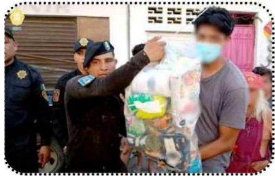
Mujeres, hombres y niños recibieron víveres y productos de higiene personal y limpieza