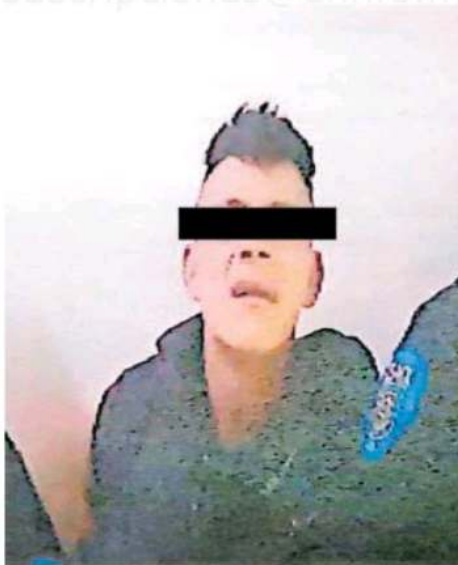
El sujeto acusado de allanamiento de morada, fue subido a una patrulla por los elementos policíacos, mismos que de inmediato lo presentaron ante el MP