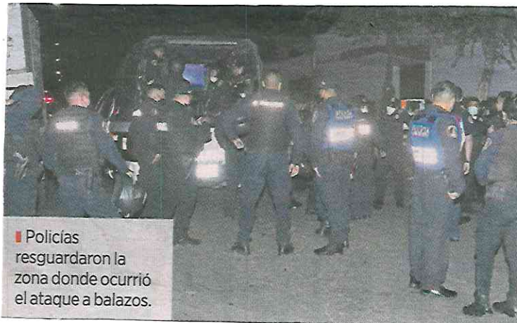
■ Policias resguardaron la zona donde ocurrió el ataque a balazos.