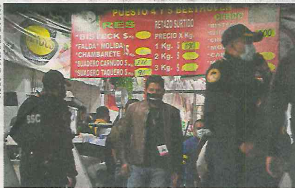
Uniformados apañaron a un sospechoso, pero como comerciantes no lo reconocieron, fue liberado.