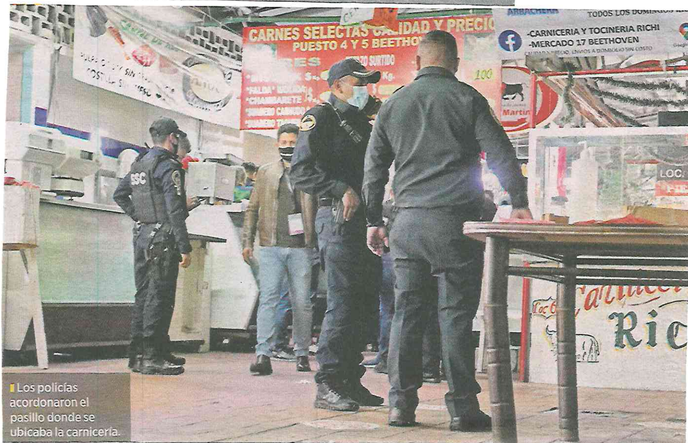
■ Los policia acordaron el pasillo donde se ubicaba la carnicería.