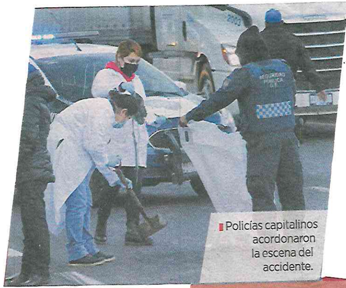
■ Policías capitalinos acordonaron la escena del accidente.

50 metros a lo largo de donde quedó regada la padecería humana