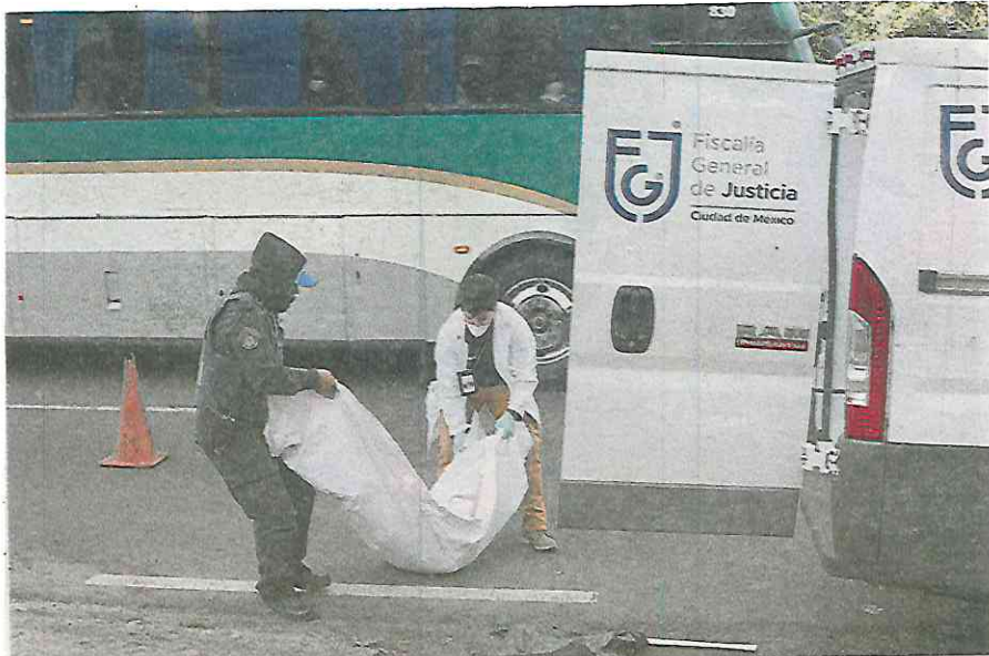
Peritos se dan a la tarea de levantar los restos de la víctima