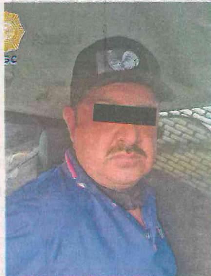
Manipulaba un arma y tras una revisión lo identificaron en El Ajusco, Alcaldía Tlalpan.

Fue durante un patrullaje de reconocimiento en el cruce de las calles Abraham