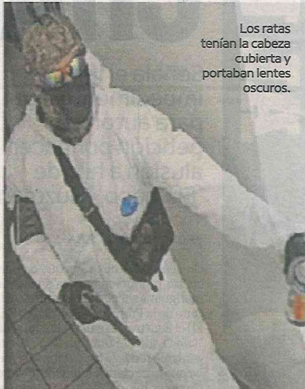
Los ratas tenían la cabeza cubierta y portaban lentes oscuros.

El gerente de la sucursal bancaria confirmó que los delincuentes acce-