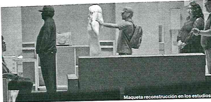
Maqueta reconstrucción en los estudios