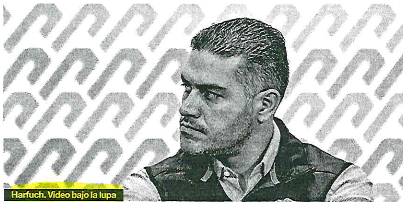
Harfuch. Video bajo la lupa

grupo armado: "No minimizamos el video, pero si tuviéramos una célula como la que sale en el video, con esas características, en una pugna o en una lucha delincencial, pues no hubiera habido sólo un homicidio doloso en noviembre en Milpa Alta". También mencionó la apertura de una carpeta de investigación por el triple homicidio en Tláhuac y dijo que ya había avances en la indagatoria.