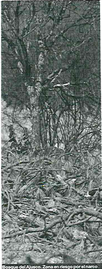
Bosque del Ajusco. Zona en riesgo por el narco

to brillan por su ausencia. La devastación es evidente. De aquel frondoso lugar repleto de pinos, encinos, robles y otras maderas preciosas ya casi no queda nada. Desde las alturas se aprecia la destrucción.