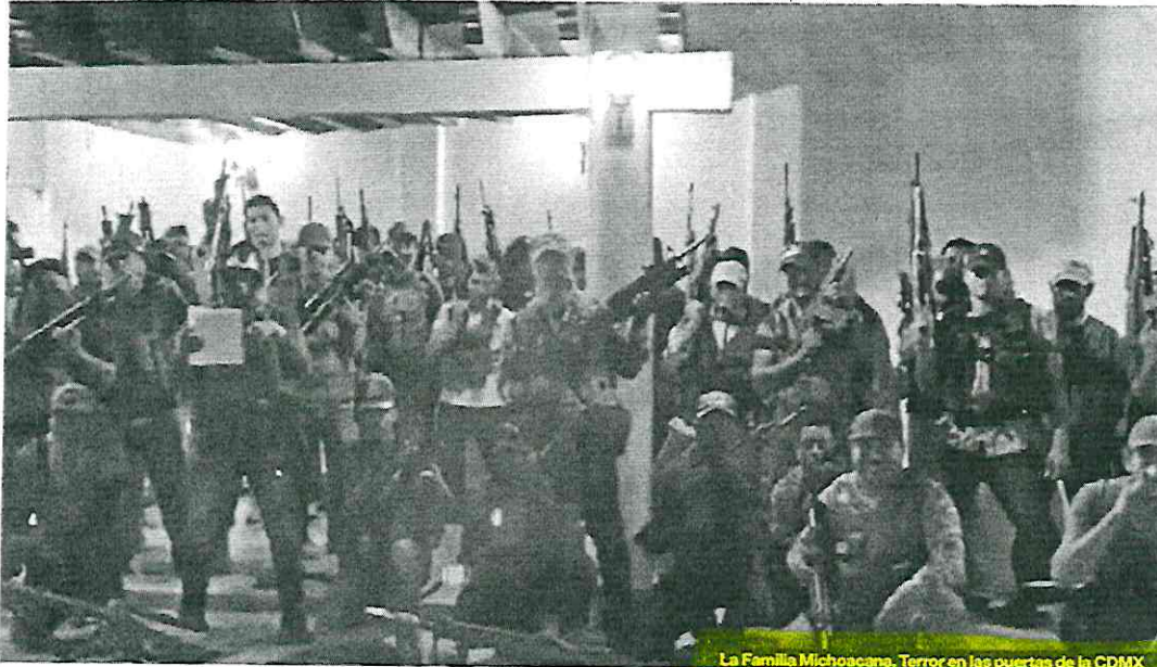
La Familia Michoacana. Terror en las puertas de la CDMX

Silvano Aureoles por sus vínculos con el narcotráfico" y su operación política en favor del cártel.