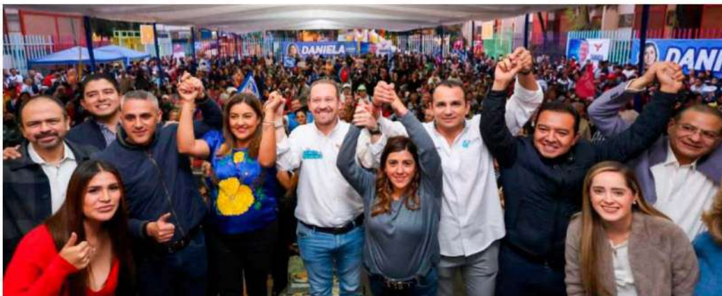
Comparó su administración con la de Clara Brugada en Iztapalapa, precandidata que según Taboada, jamás trabajó para que los habitantes de esa demarcación tuvieran mejor calidad de vida.