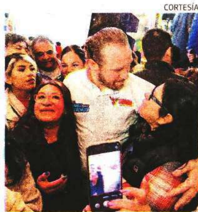
Apuesta por una ciudad más segura.

Taboada pidió reflexionar a los capitalinos sobre "cómo queremos ver la ciudad los próximos seis años. AIDA RAMÍREZ