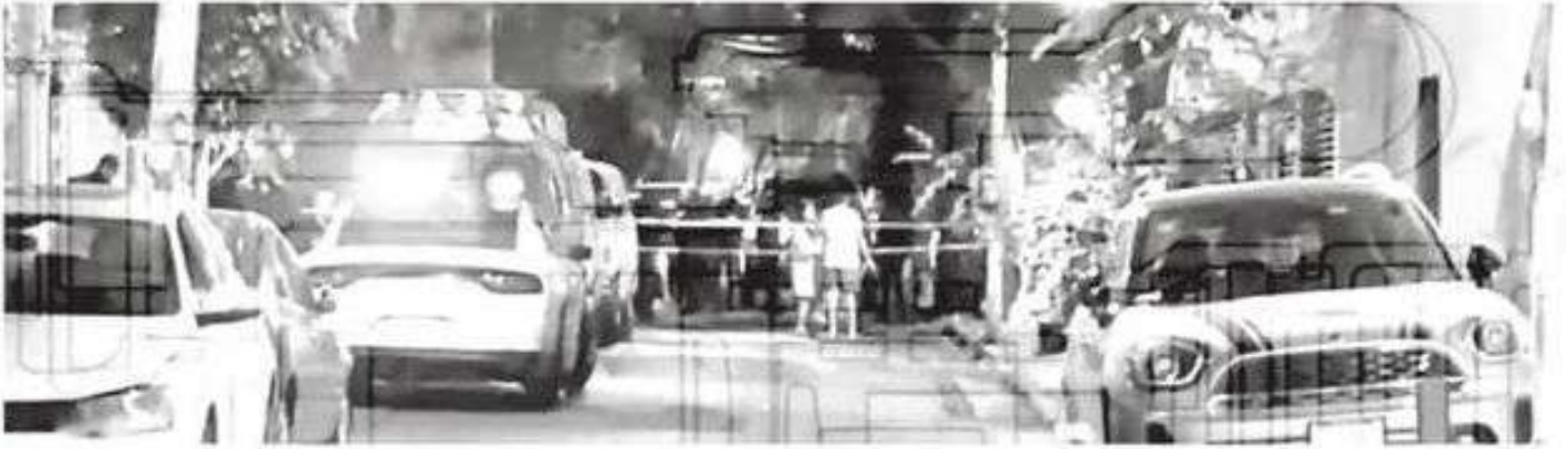
El hecho desencadenó una intensa movilización pollaca