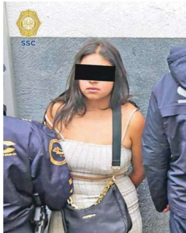
El hombre de 27 años de edad y la mujer de 21 años fueron detenidos y presentados ante el agente del MP, quien definirá su situación legal