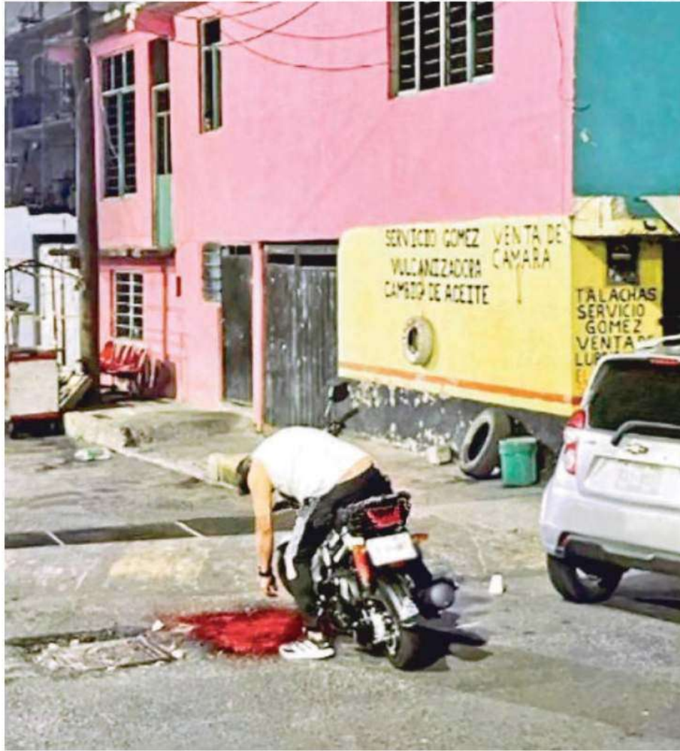
El cuerpo del presunto ladrón quedó sobre la motocicleta, debido a que intentaba darse a la fuga