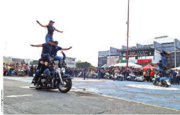
MILES de motociclistas se dieron cita en la explanada de la alcaldía Venustiano Carranza, ayer.