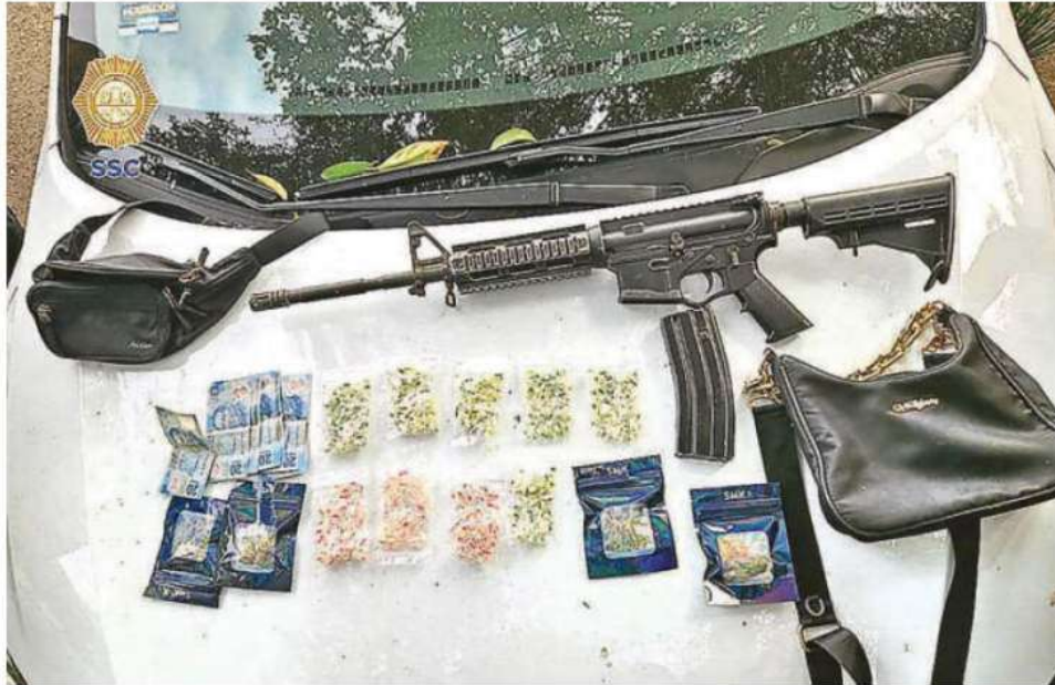
Asegurados un arma de fuego larga, un cargador y nueve cartuchos útiles, y aparente cocaína y marihuana