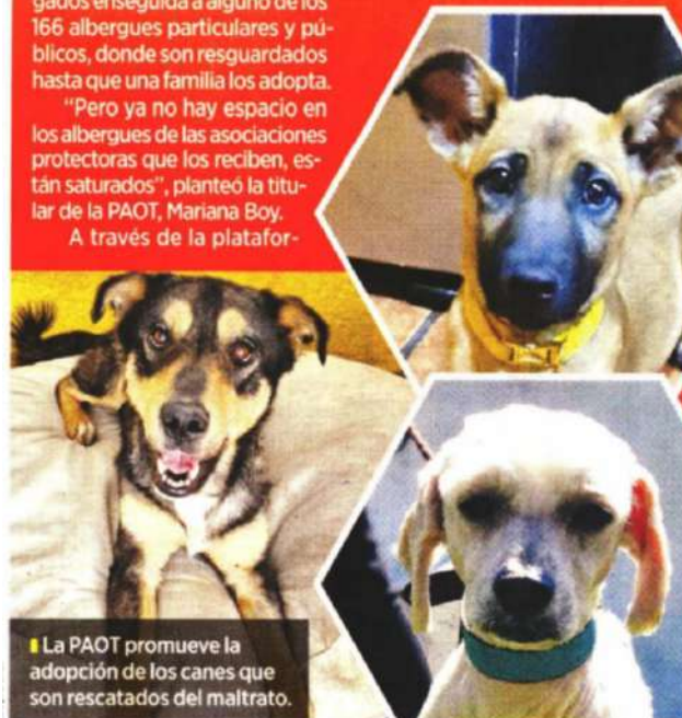
La PAOT promueve la adopción de los canes que son rescatados del maltrato.

En la Ciudad hay 700 asociaciones protectoras, de las cuales, 161 están activas. También, funcionan los albergues de la Brigada de Vigilancia Animal de la Secretaría de Seguridad Ciudadana (SSC), del Metro, la Central de Abasto (Ceda) y de las alcaldías Iztapalapa y Magdalena Contreras. Todas reportan saturación, agregó Boy.