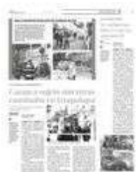
Resultaron heridos de gravedad