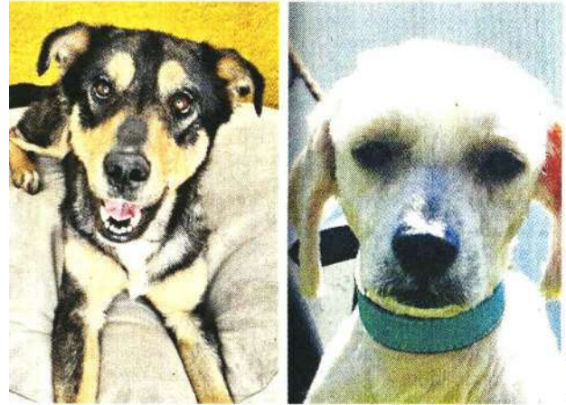
La PAOT promueve la adopción de los canes que son rescatados del maltrato, como este par.