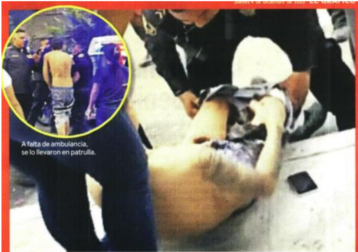
A falta de ambulancia, se lo llevaron en patrulla.