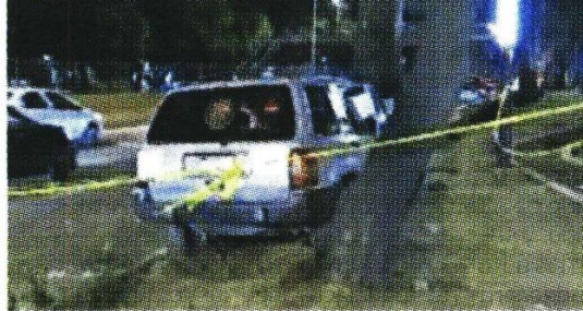
La circulación continuó porque quedó en el camellón.

Policías de la Secretaría de Seguridad Ciudadana (SSC) dieron aviso al Ministerio Público, mientras acordonaron la zona. Debido a que el carro quedó sobre el camellón, no fue necesario que se hiciera algún corte a la circulación.