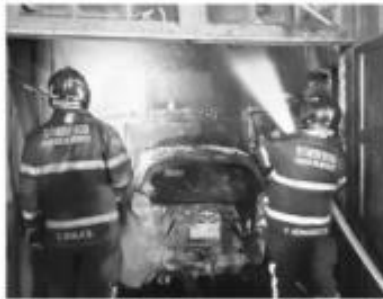
- Bomberos controlaron los siniestros