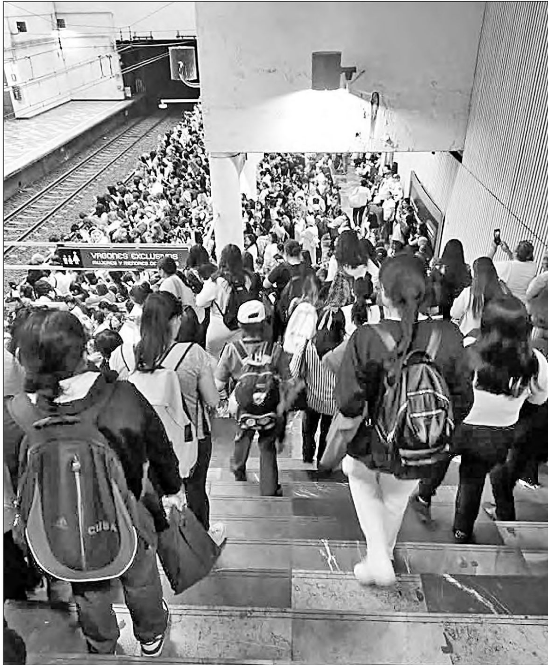
▲ Cientos de usuarios se aglomeraron en la terminal Pantitlán en espera de un convoy, debido a las fallas del sistema eléctrico de la línea A del Metro.