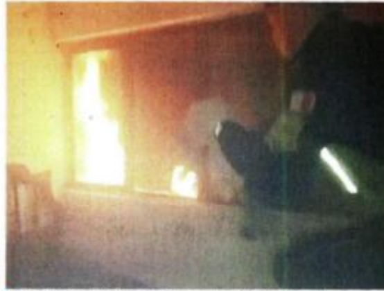
Bomberos combatieron el incendio hasta sofocarlo.