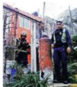
De manera controlada, tuvo que ser vaciado el cilindro.