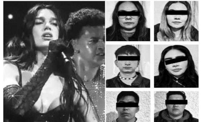
· Preferida de los malandros

Cabe recordar que Dua Lipa ofrecerá conciertos adicionales el 2 y 5 de diciembre, por lo que las autoridades capitalinas mantendrán operativos especiales.