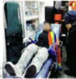
El joven fue trasladado a un hospital para ser atendido por las quemaduras.

Finalmente, bomberos apagaron el incendio y vaciaron el cilindro de gas de forma controlada para evitar riesgos.