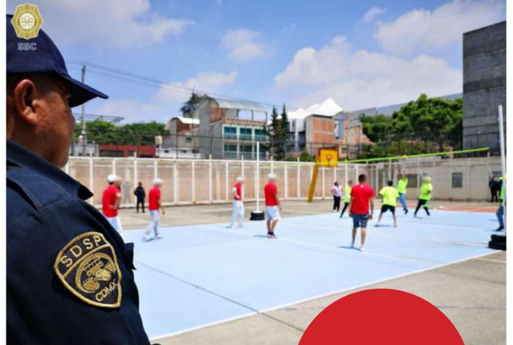
De los 969 adolescentes de 14 a 17 años fueron recluidos del 2020 al 2025, 69 son mujeres y 910 son hombres.

ALCALDÍAS CON MÁS MENORES DE 11 A 17 AÑOS DETENIDOS 2021 - 2025