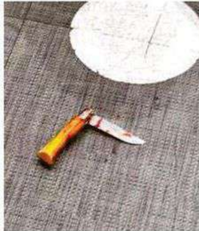
El presunto responsable de este hecho de violencia fue detenido y remitido ante las autoridades junto con el arma blanca.