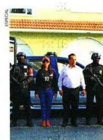
VC reportó mil 462 delitos de alto impacto en 2023, según la FGJ.

desplegadas en la mayoría de las colonias recibieron mantenimiento.