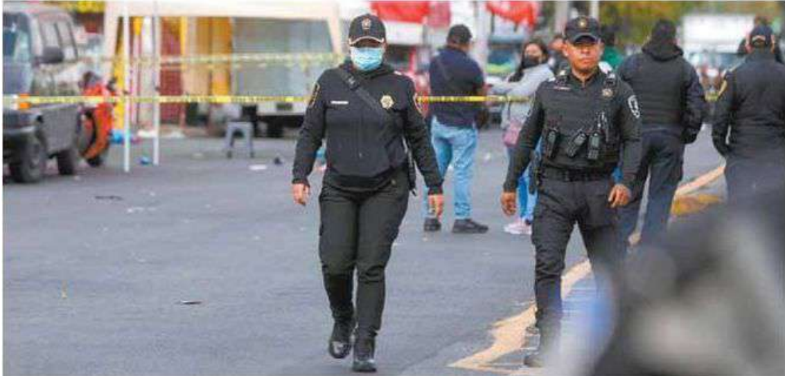
• Dos personas acusadas de extorsión fallecieron.