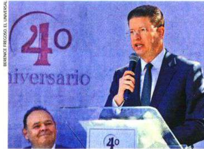
El jefe de la policía capitalina advirtió que se actuará con todo el peso de la ley, y no se ocultarán los hechos, como ocurría antes.