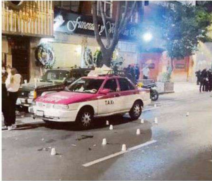
Los responsables huyeron con rumbo desconocido