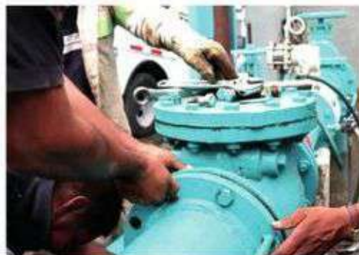
Distribución ilegal del líquido

El titular del Sacmex, Rafael Carmoña, explicó que durante el operativo se descubrió una toma irregular desde una de las líneas principales del acuaferico