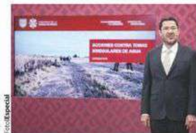
EL JEFE de Gobierno, Martí Batres, durante la conferencia de prensa de ayer.