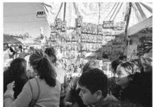
Desde las 8 de la mañana ponen sus puestos

Aceptan pago con tarjeta bancaria o transferencia electrónica