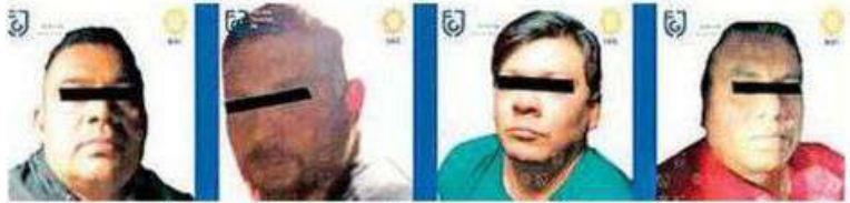
Cuatro son trasladados al Reclusorio Norte por portación de arma de fuego