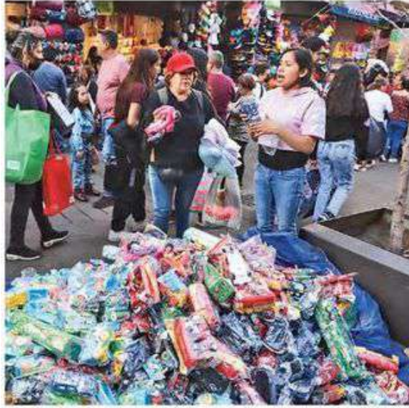
VARIEDAD. Pelotas, carritos de diversos tamaños y colores, trenes, personajes de acción, muñecas, dinosaurios, peluches, figuras a control remoto y con luz, son algunos juguetes que se venden en previo al Día de Reyes.