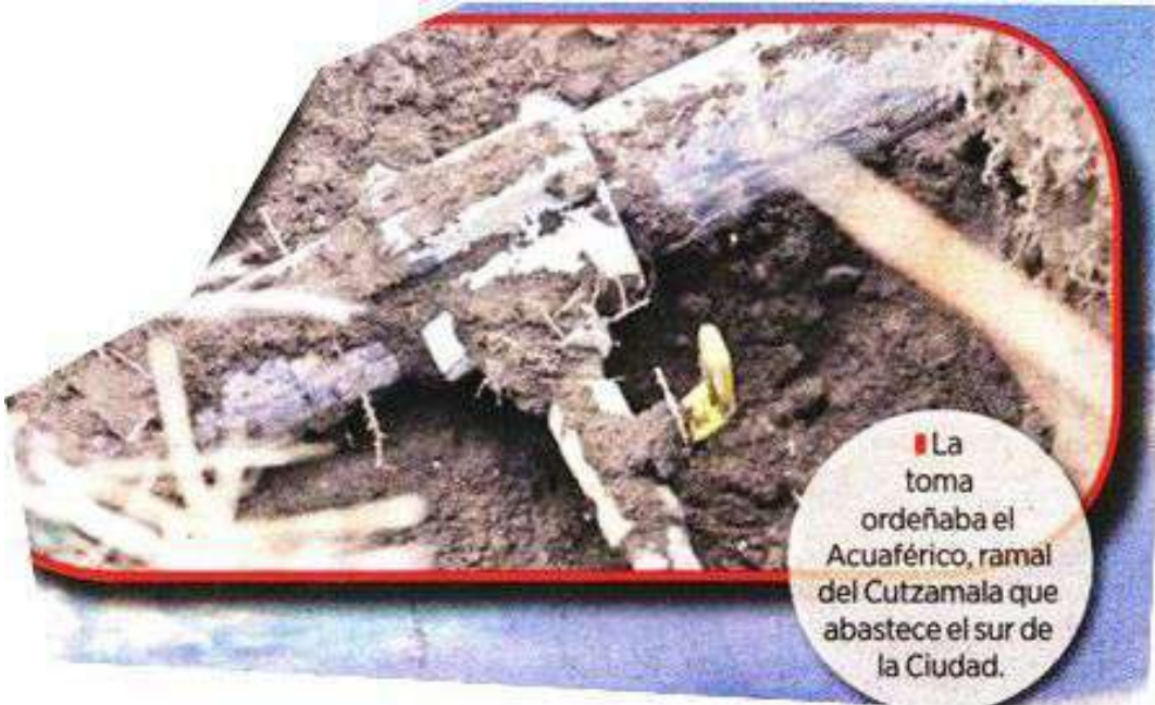
■ La toma ordeñaba el Acuaférico, ramal del Cutzamala que abastece el sur de la Ciudad.