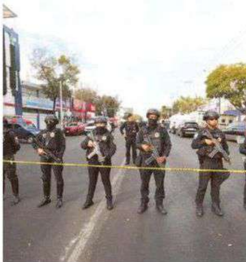
Esta semana sucedió un enfrentamiento entre presuntos extorsionadores y policías de la ciudad en un tianguis de la alcaldía Iztacalco