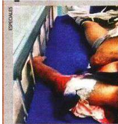
El ataque estaría relacionado con problemas de tipo familiar.

Según cifras del Secretariado Ejecutivo del Sistema Nacional de Seguridad Pública en Miguel Hidalgo se registraron 15 homicidios dolosos con arma de fuego de enero a noviembre de 2023.