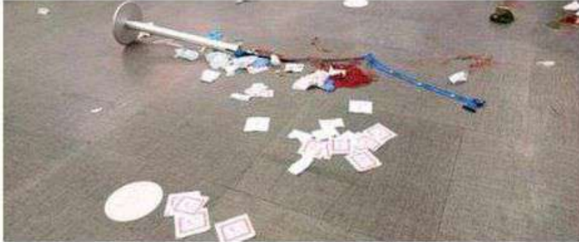
Policias encontraron a la víctima ensangrentada en el lugar y a un costado de él su esposa, que lloraba asustada pidiendo auxilio

De acuerdo con los primeros reportes en ese lugar se desató una riña entre un hombre de nacionalidad mexicana y un venezolano