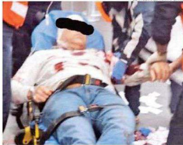
La víctima sufrió una herida en el cuello y otra en la cabeza

El 12 de septiembre, la SSC capturó a un presunto implicado en el robo de camiones de carga en la zona de aduanas. Momentos antes, el sujeto le disparó a policía.