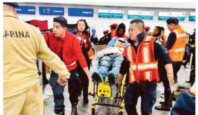
Paramédicos diagnosticaron que la víctima tenía una lesión punzocortante en el cuello y otra en la cabeza, por lo que fue trasladado a un hospital para su atención médica