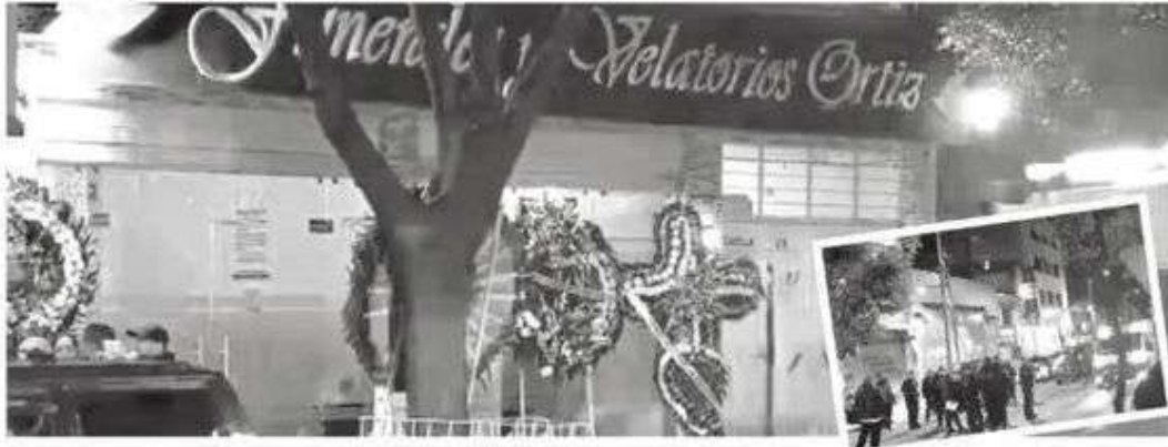
Los asistentes al sepelio vivieron noche de terror