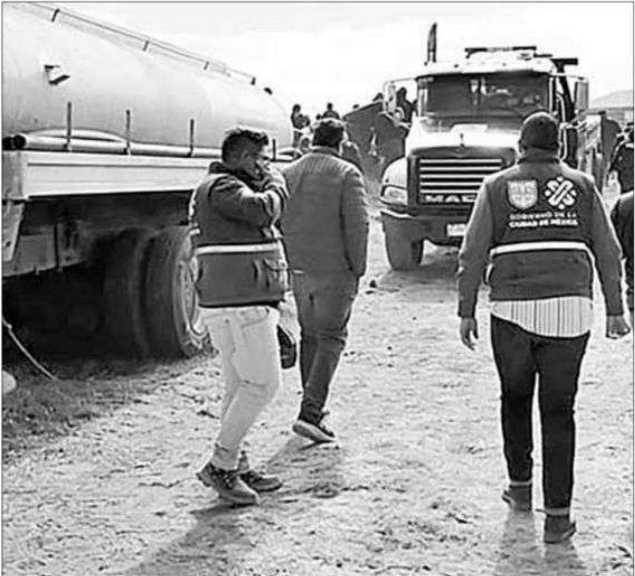
▲ En el operativo para la clausura de la toma clandestina de agua en el pueblo de Magdalena Petlacalco, en la alcaldía Tlalpan, se aseguraron tres pipas, sin que hubiera personas detenidas.