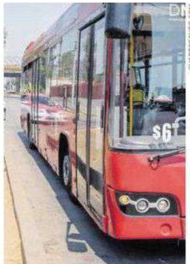
Pagarán hasta de 6 mil pesos.

De acuerdo con el Reglamento de Tránsito, en el Artículo 11 los conductores de cualquier tipo de vehículo, no pueden circular sobre los carriles exclusivos para el transporte público en el sentido de la vía o en contraflujo. Señala que los vehículos que cuenten con la autorización, como ambulancias, bomberos, patrullas o aquellos que estén identificados para atender una emergencia, requieren de una autorización, para poder transitar por ellos y deberán conducir con faros delanteros encendidos.