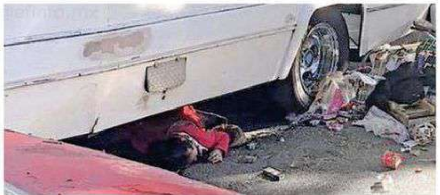
La víctima, de aproximadamente 70 años de edad, queda tendida sobre el pavimento debajo de la unidad

Posteriormente, integrantes del área pericial y Forense de la Fiscalía capitalina, se presentaron en el sitio y tras recabar los indicios necesarios para esclarecer los hechos, procedieron a realizar el levantamiento del cadáver, para trasladarlo al anfiteatro correspondiente.