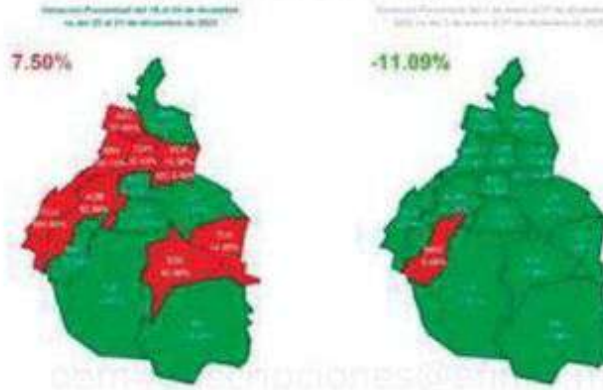
Semáforo de Delitos de Alto Impacto por Alcaldía

La demarcación presentó esta disminución en la incidencia delictiva inclusive por encima de la baja reportada en toda la Cdmx