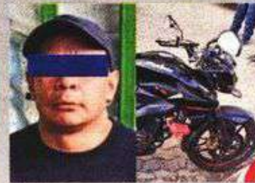
Al sospechoso le aseguraron una moto y una bolsa con marihuana.