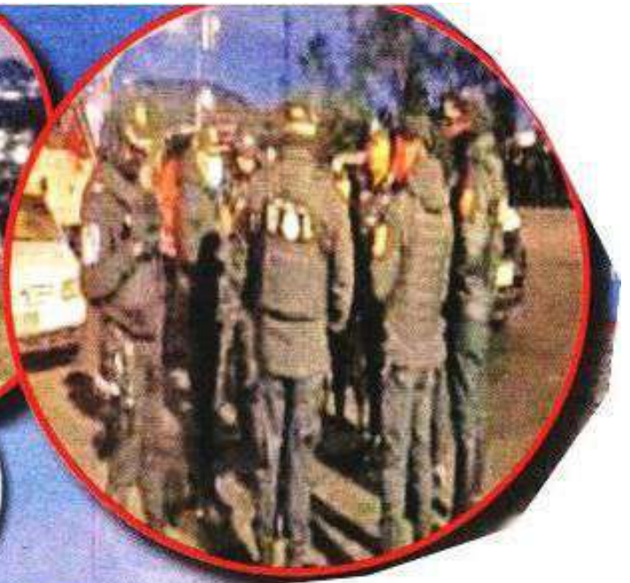
■ El operativo para desactivar la toma clandestina se desplegó el miércoles, en la Alcaldía Tlalpan.