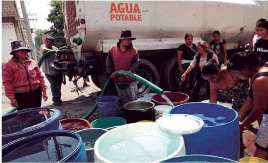
Delito. La Ciudad de México busca inhibir el huachicoleo de agua en plena crisis hídrica en múltiples colonias de la capital.