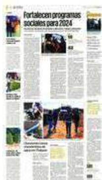
La toma irregular estaba conectada con una de la líneas principales del acuafero central, que enlaza a Tlalpan con el Cutzamala.