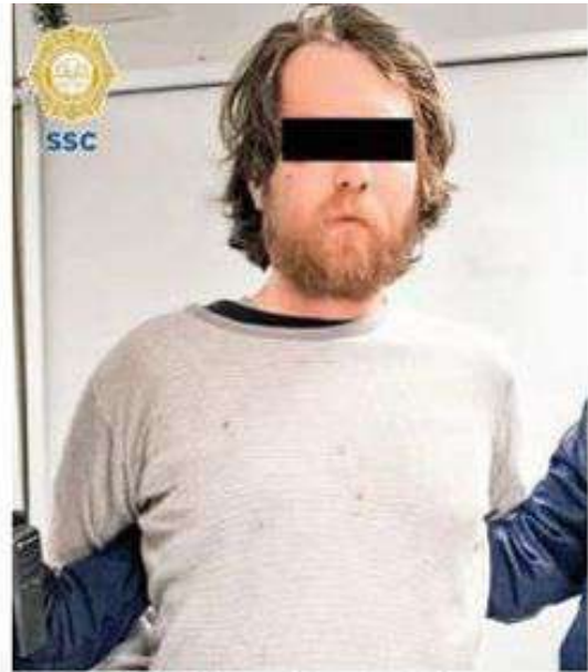
RESPONSABLE. Un mexicano de 26 años es el presunto autor de la agresión, por lo que fue detenido y presentado en el Ministerio Público.

Respecto al presunto agresor, los efectivos le realizaron una revisión preventiva, donde hallaron una navaja de 25 centímetros de largo, por lo que el hombre de 26 años fue aprehendido y puesto a disposición del agente del Ministerio Público correspondiente. /ÁNGEL ORTIZ