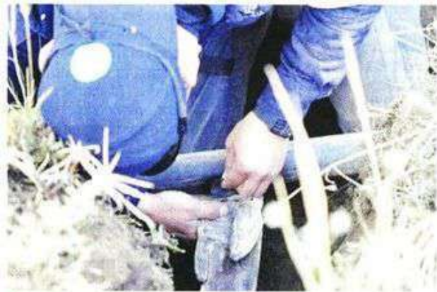
■ La toma ordeñaba el Acuaférico, ramal del Cutzamala que abastece el sur de la Ciudad.

Desde noviembre, la Comisión Nacional de Agua (Conagua) redujo el abasto del Sistema Cutzamala, debido al bajo nivel en las presas.