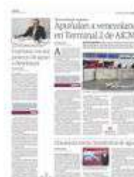
EL LUGAR en donde ocurrió el incidente fue acordonado por las autoridades, ayer.