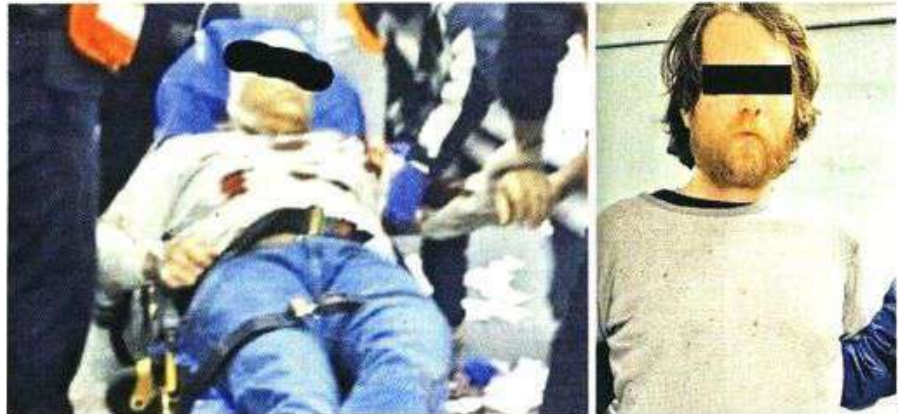
El venezolano fue atacado con arma blanca por otro pasajero de nacionalidad mexicana (der.).

El AICM ha sido escenario de otros incidentes, como balaceras, ataques con arma blanca y el atraco a usuarios. El agosto se reportó una balacera en el estacionamiento de la Terminal 2, en la que participaron policías de Nezahualcóyotl con saldo de dos heridos.