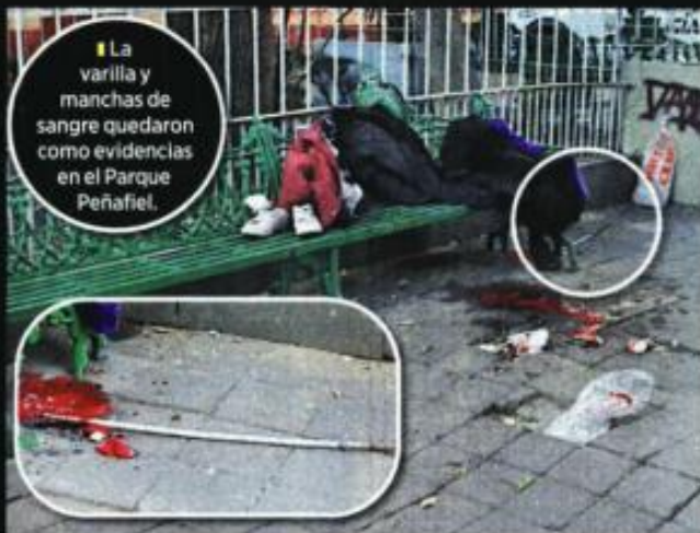
■ La varilla y manchas de sangre quedaron como evidencias en el Parque Peñafiel.

Los primeros en llegar fueron agentes preventivos del Sector As-