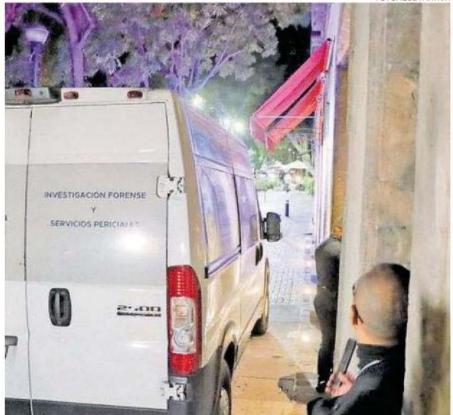
El hallazgo ocurrió en un inmueble situado en el cruce de Cerrada del Zapote y Tercera Privada de Ignacio Allende