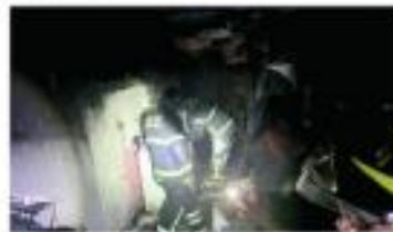
Las llamas arrasaron con todo

Las autoridades no reportaron lesionados ni intoxicados durante el incendio.