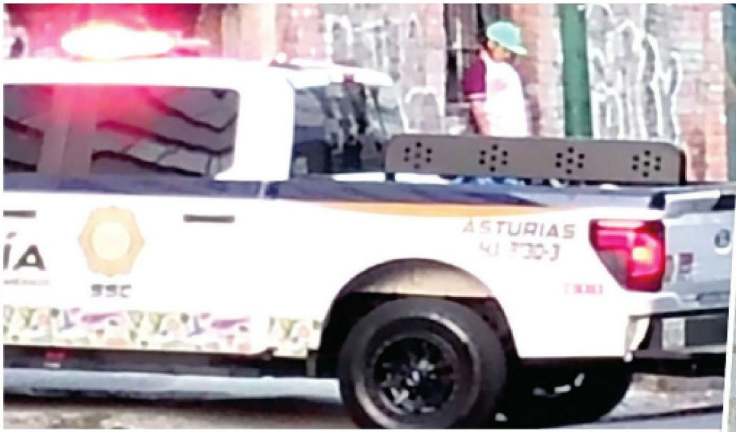
Al parecer el mismo joven se colgó