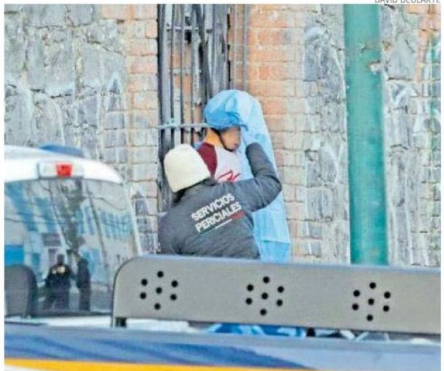
Peritos llevaron a cabo el procesamiento del lugar, así como el levantamiento del cuerpo