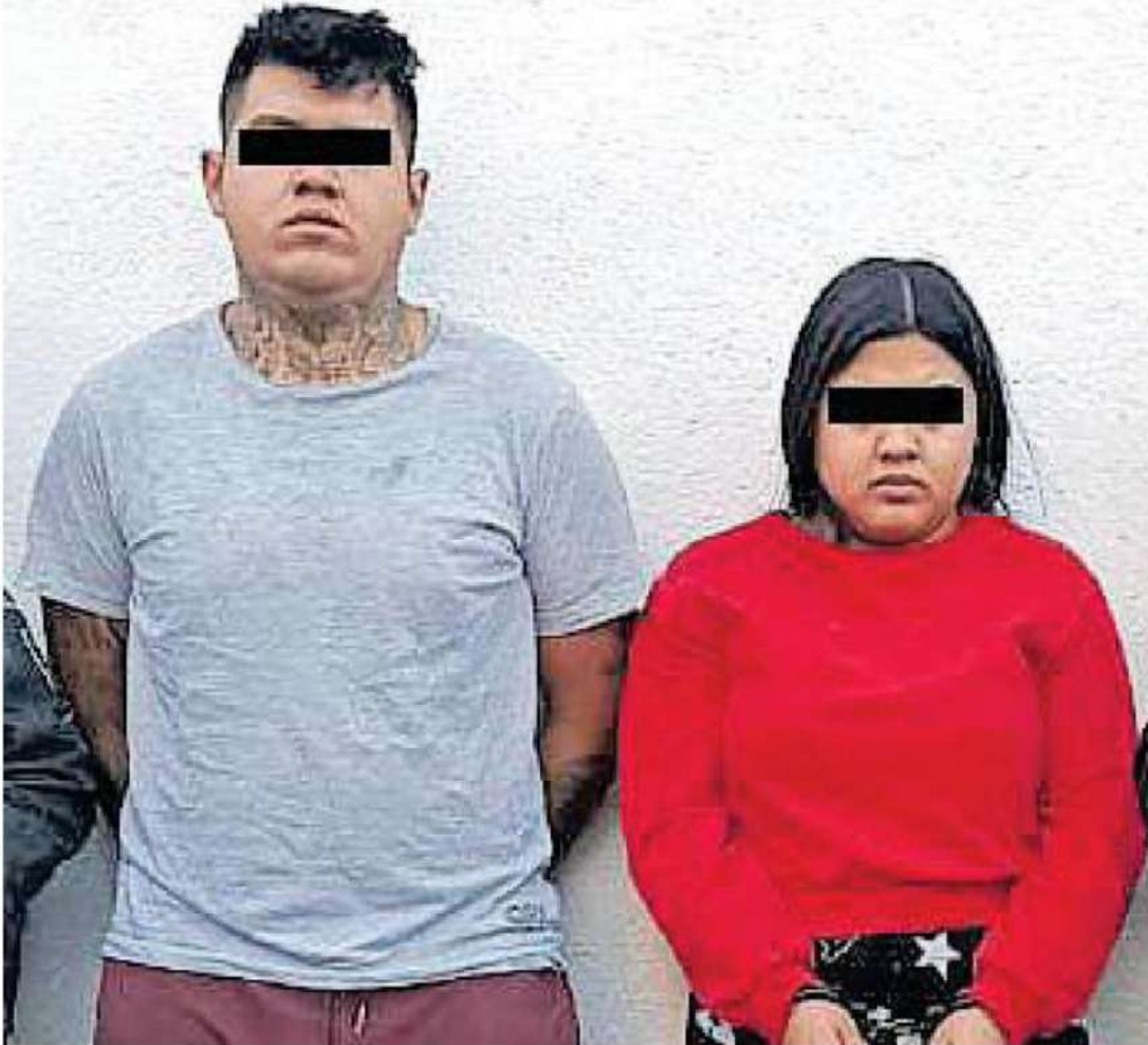
Los dos imputados y los objetos asegurados fueron presentados ante la Fiscalía de Investigación Estratégica del Delito de Robo de Vehículos y Transporte