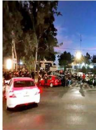
DESCONTENTO. Alrededor de 70 elementos expresaron su molestia debido al hostigamiento laboral.

De igual forma, se llevarán a cabo las indagatorias correspondientes sobre las conductas reportadas por los policías a fin de deslindar responsabilidades y actuar conforme a la ley. /24HORAS