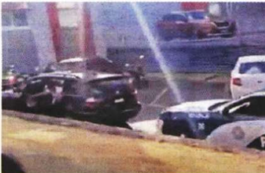
Un automovilista grabó una parte de la persecución.

Los sujetos, quienes ingresaron a una casa de la colonia Contadero para robar una camioneta, fueron trasladados a las instalaciones de la Fiscalía de Investigación Territorial de Azcapotzalco, donde algunos recibieron atención médica por las lesiones que sufrieron en su huida.