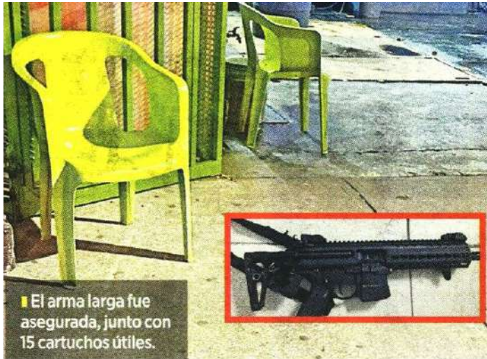
El arma larga fue asegurada, junto con 15 cartuchos útiles.