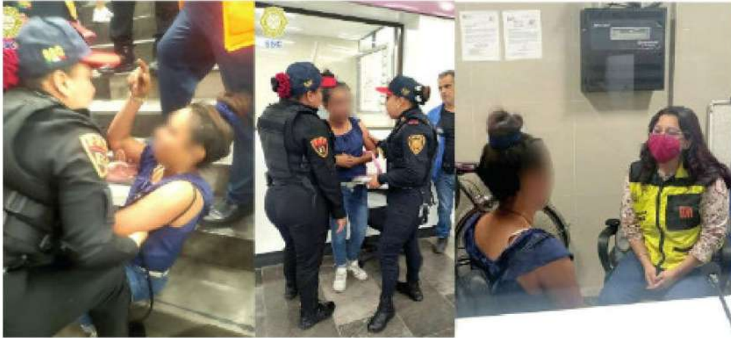
·Menores dramáticos se vieron en el transporte masivo