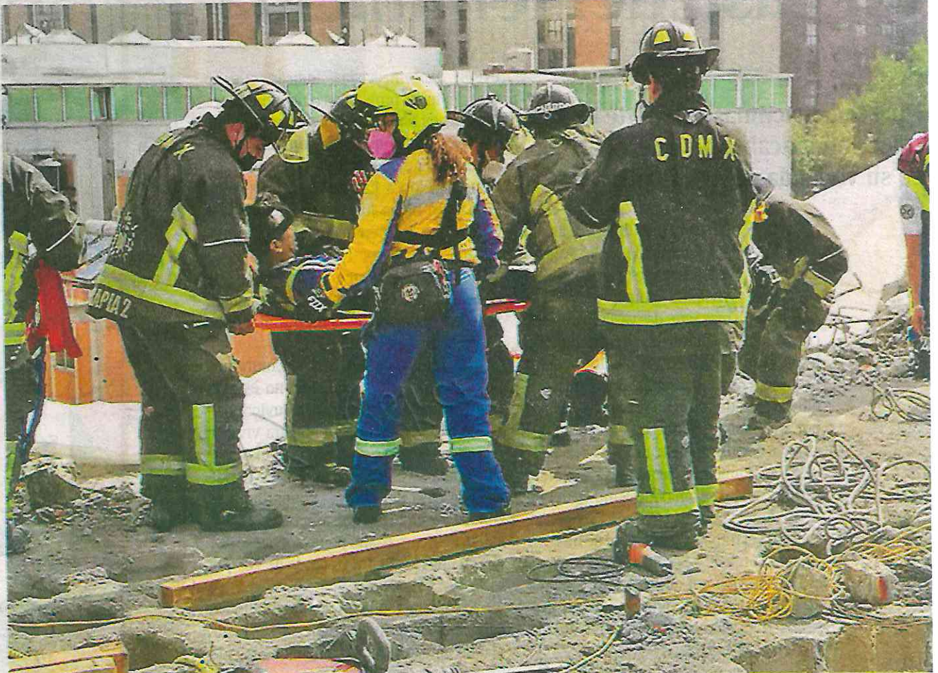
Luego de asegurado fue llevado de urgencia al hospital