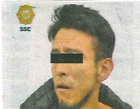
El detenido y los envoltorios con la supuesta droga fueron puestos a disposición del MP

Por tal motivo, el hombre de 29 años de edad fue detenido, informado de sus derechos constitucionales y remitido ante el agente del Ministerio Público correspondiente, quien definirá su situación jurídica.