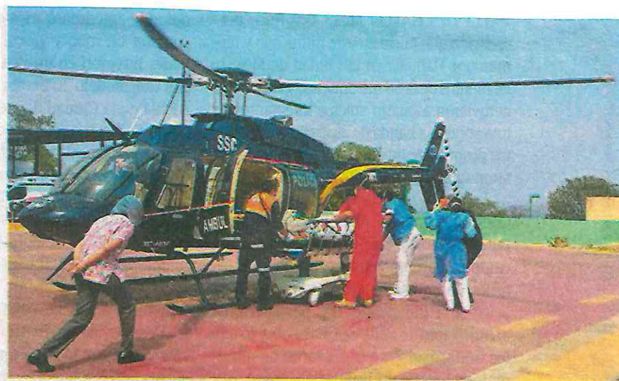
Minutos cruciales en la unidad aérea para atender a la mujer de un mal cardíaco

En el lugar, los Cóndores entregaron a la ciudadana a personal médico, quien se encargará de brindarle la atención correspondiente a su estado de salud.