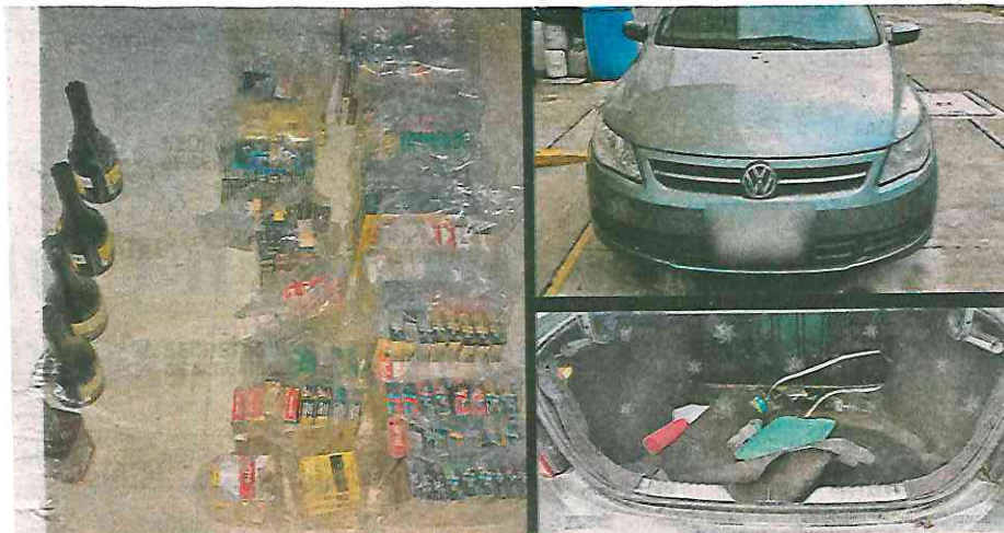
Otra vez la tecnología localizó a la banda con el botín

Después de un fuerte operativo policiaco, uniformados dieron alcance a los sospechosos sobre la Avenida la Turba, en la colonia Granjas Cabrera, de la Alcaldía Tláhuac; en el sitio, detuvieron a Juan "N",