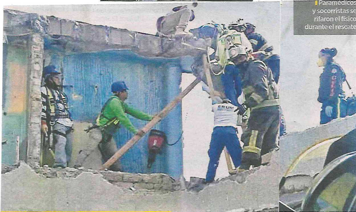
Paramédicos y socorristas se rieron el físico durante el rescate.