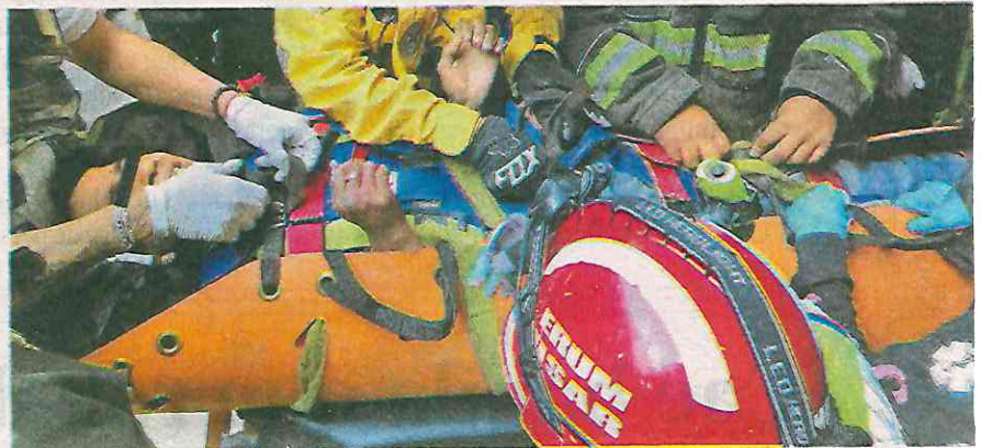
Debido a la altura y estrecho de la construcción fue bajado con cuerdas