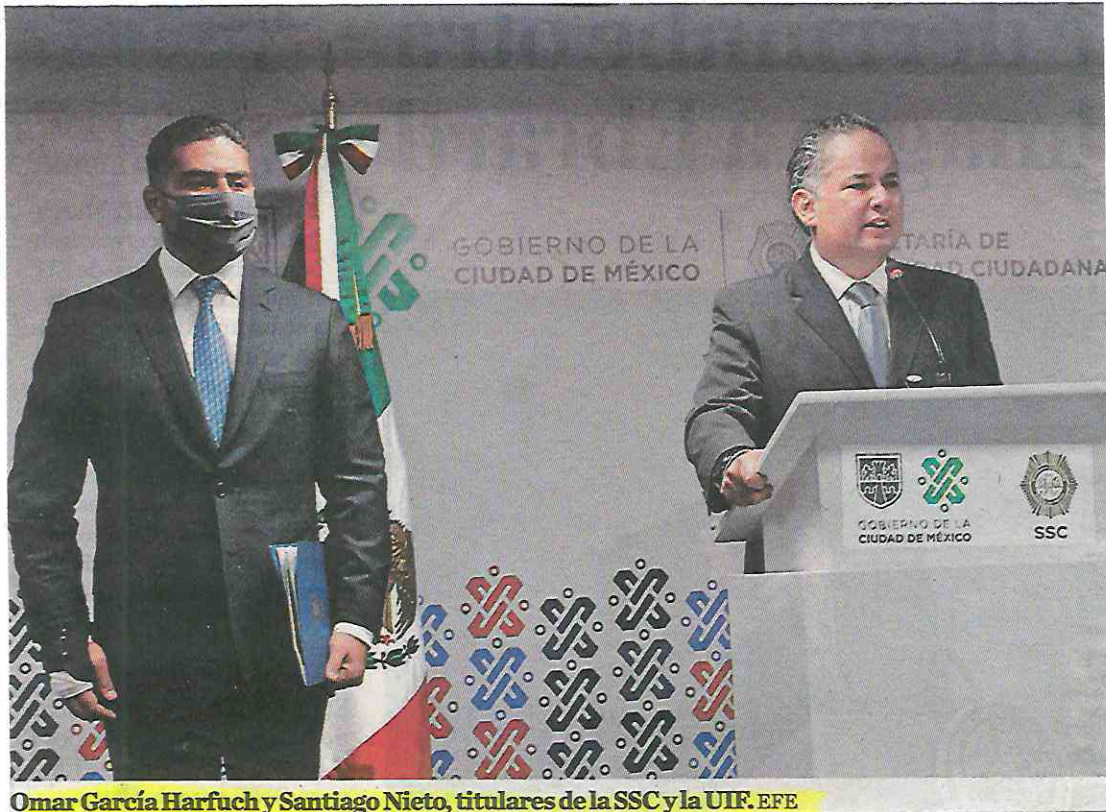
Omar García Harfuch y Santiago Nieto, titulares de la SSC y la UIF.