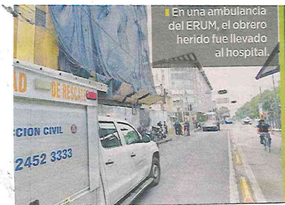
En una ambulancia del ERUM, el obrero herido fue llevado al hospital.