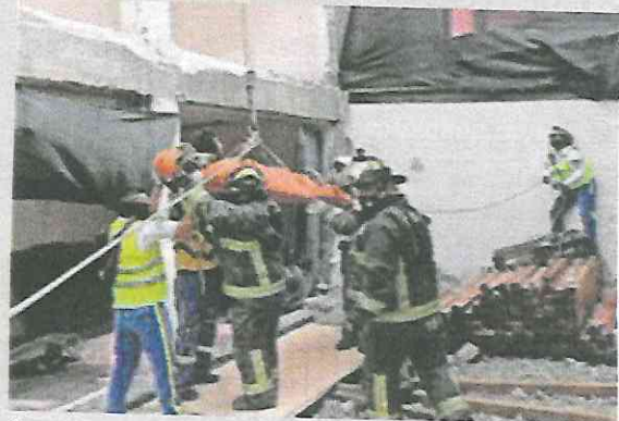
Paramédicos 'volaron' al obrero desde el sexto piso; tiene fractura expuesta de tibia y peroné del pie derecho.