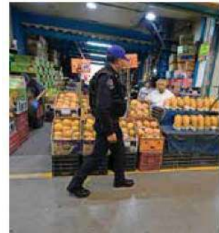
• ATENTOS. Personal de la SSC realiza vigilancia.