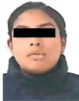
Incurrió en un abuso