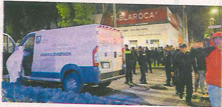
Crimen al amparo de la noche

Por la forma en que fue cometido este crimen, los encargados de las investigaciones presumen que se trata de un ajuste