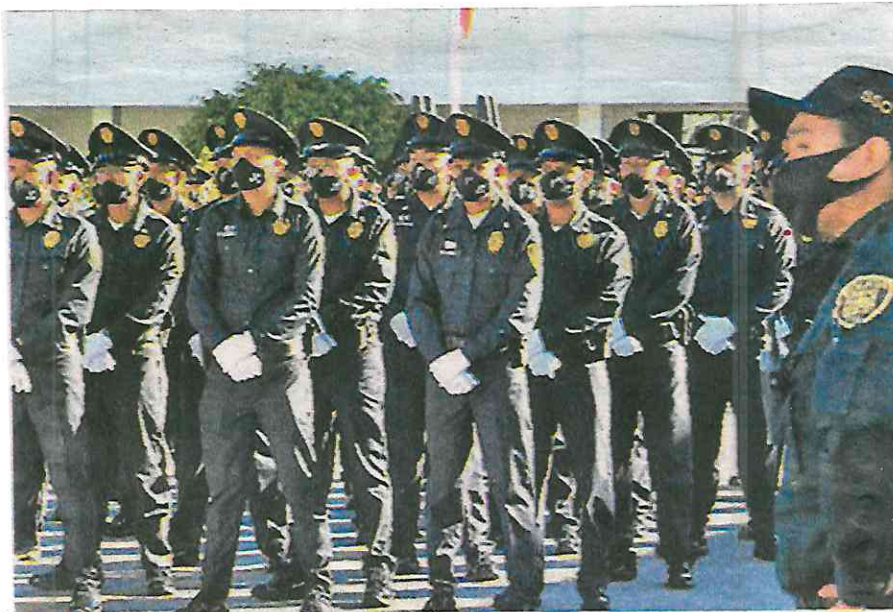
Es prioridad del gobierno de la capital la dignificación de la función policial