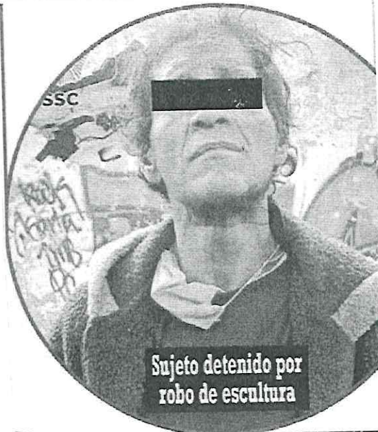
Sujeto detenido por robo de escultura