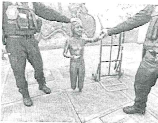
Reinstalación. Esta misma semana será reinstalada la estatua que forma parte del monumento creado por el escultor Miguel Ángel Campos Ortiz.

Luego de que se informó de la recuperación de la 'niña', el presidente del Consejo agradeció a las autoridades competentes e informó que será reinstalada esta misma se-