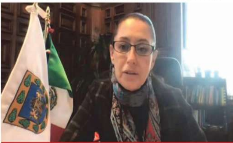
Claudia Sheinbaum, jefa de Gobierno de la Ciudad de México, en una conferencia de prensa virtual.

❖ La Jefa de Gobierno capitalino aseguró que su administración buscará el punto de equilibrio entre proteger la salud de los habitantes y los ingresos de las familias