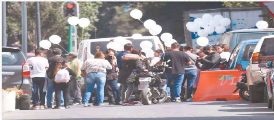
Familiares acudieron al domicilio de los menores para soltar globos blancos para despedirlos.