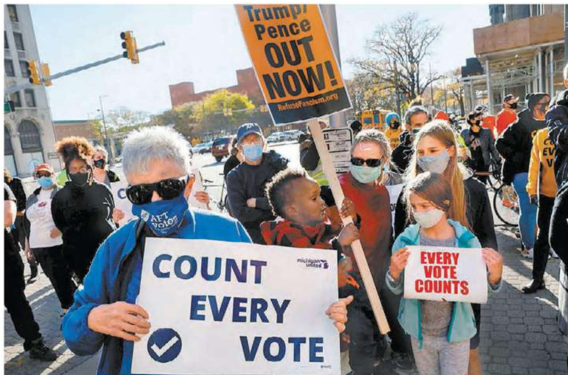
Las protestas replicadas en diversos estados, en exigencia de que se cuenten todos los votos, encaminan el proceso a tribunales.