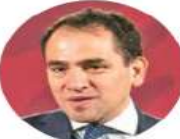
Arturo Herrera, titular de la SHCP.

Destacó que, por ejemplo, la reforma al sistema de pensiones que se entregue al Congreso de la Unión busca garantizar que más mexicanos tengan acceso a una pensión digna a su retiro, además de que ayudará