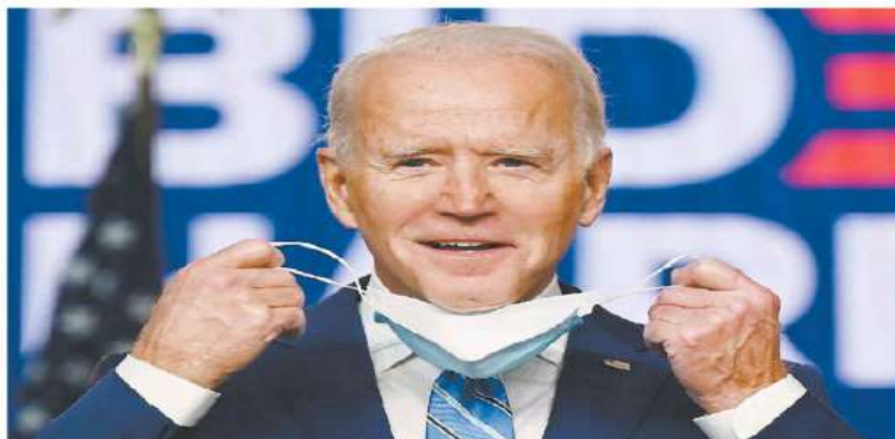
Biden, con más de 70 millones de votos, es el candidato presidencial de EU con mayor apoyo en la historia.