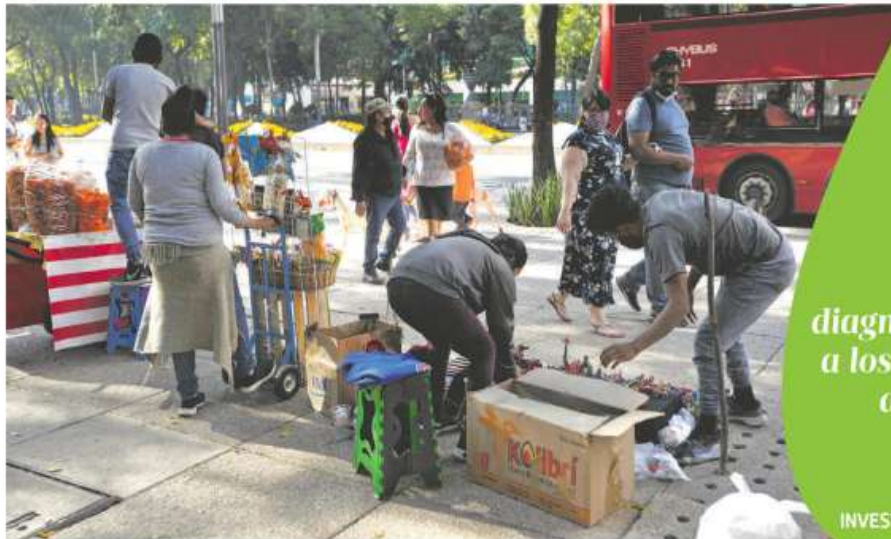
Entre mayo y julio trabajadores en vía pública ganaban sólo 100 pesos diarios

EN LA Ciudad de México se realizan, en promedio, más de siete mil pruebas PCR diarias para detectar casos de Covid-19