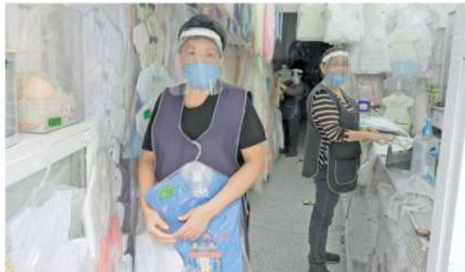
Este fin de semana se decidirá si se retoman medidas restrictivas en algunas actividades económicas de la capital

"Ese trabajo intensivo en el territorio nos ha permitido abrir actividades económicas y al mismo tiempo que no sigan creciendo las hospitalizaciones en la ciudad, entonces hemos sido muy responsables en esto hasta la fecha, si requerimos cerrar algunas actividades lo vamos hacer pero tampoco vamos a cerrar forzada-