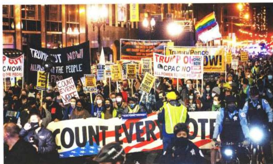
MANIFESTANTES marchan en Chicago, ayer, para exigir que todos los votos se cuenten en las elecciones.

Demócratas no logran minar a republicanos en el Congreso, retienen mayoría en la Cámara de Representantes, pero apenas; el Senado sigue siendo republicano.