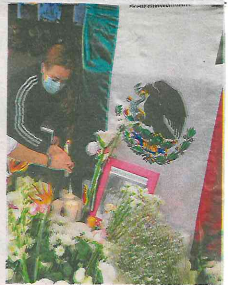
Familiares y amigos piden esclarecer el doble crimen / ADRIÁN VÁZQUEZ

El sujeto fue detenido como parte de las investigaciones por el doble homicidio