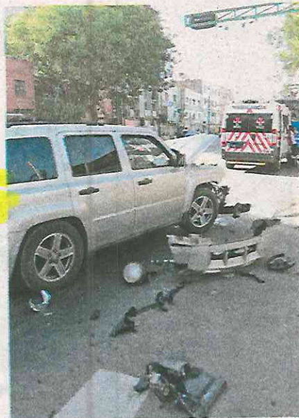
Los altercados viales con este modus operandi se realizan en Calzada de Tlalpan

Hizo notar que esa modalidad de robo o estafa funciona por medio de impactos ocasionados de forma dolosa por sujetos en vehículos, quienes posteriormente, exigen el pago en indemnización a la unidad.