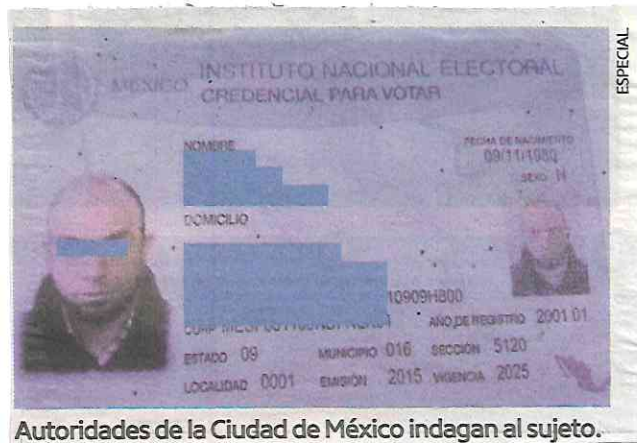
Autoridades de la Ciudad de México indagan al sujeto.