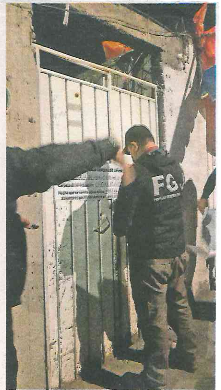
Los cateos se realizaron en las colonias Ampliación Tepepan, El Mirador y San Sebastián, alcaldía Xochimilco

Luego de obtener la identidad de los detenidos, efectivos de la Policía de Investigación (PDI) examinarán las bases de datos a fin de determinar si cuentan con antecedentes penales o están relacionados con otros delitos.