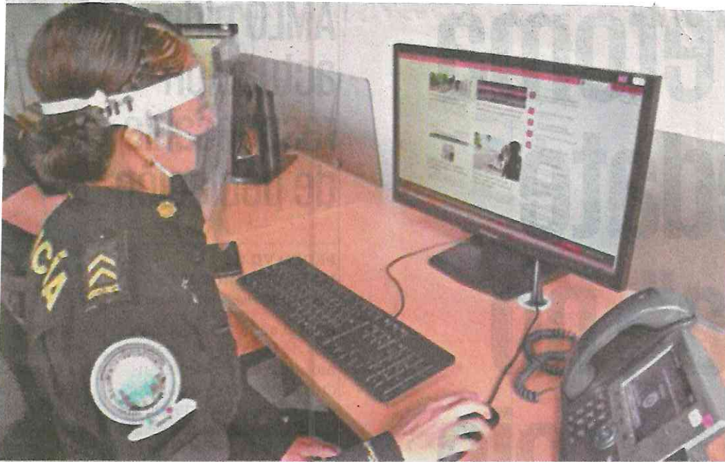
La Policía Cibernética realiza un constante monitoreo de la red, e incluso ha solicitado a Facebook dar de baja perfiles ligados a posibles delitos. Piden a la población denunciar.

menores con fines de pederastia, aumentó 8%.