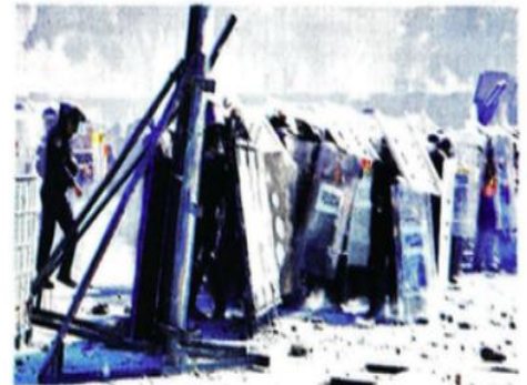
El Congreso dará seguimiento a los hechos ocurridos el 15 de noviembre.

Diputados aprobaron que la Comisión Especial actúe con estricta observancia de los principios de legalidad, imparcialidad, objetividad, respeto a los derechos humanos y pre-