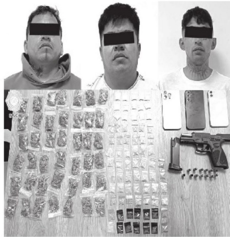
Eran pasados de lanzas

Los detenidos están vinculados con un homicidio previo y fueron puestos a disposición de la Fiscalía para continuar con las investigaciones. La SSC mantiene operativos en la zona para prevenir más extorsiones.