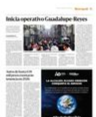
Se espera la llegada masiva de visitantes a la Ciudad de México, entre turistas y peregrinos.