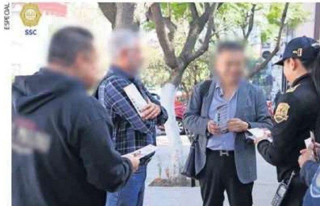
Elementos de la SSC realizaron un operativo en la colonia Lomas de Chapultepec, para alertar a vecinos de modalidades de robo a casas.

Ayer, la SSC realizó un operativo preventivo, con el despliegue de 500 elementos en la colonia Lomas de Chapultepec, alcaldía Miguel Hidalgo, para alertar a residentes y personal doméstico de la modalidad de fraude del 'falso repartidor', así como el denominado 'La Patrona', en el que el delincuente se hace pasar por la empleadora. ●