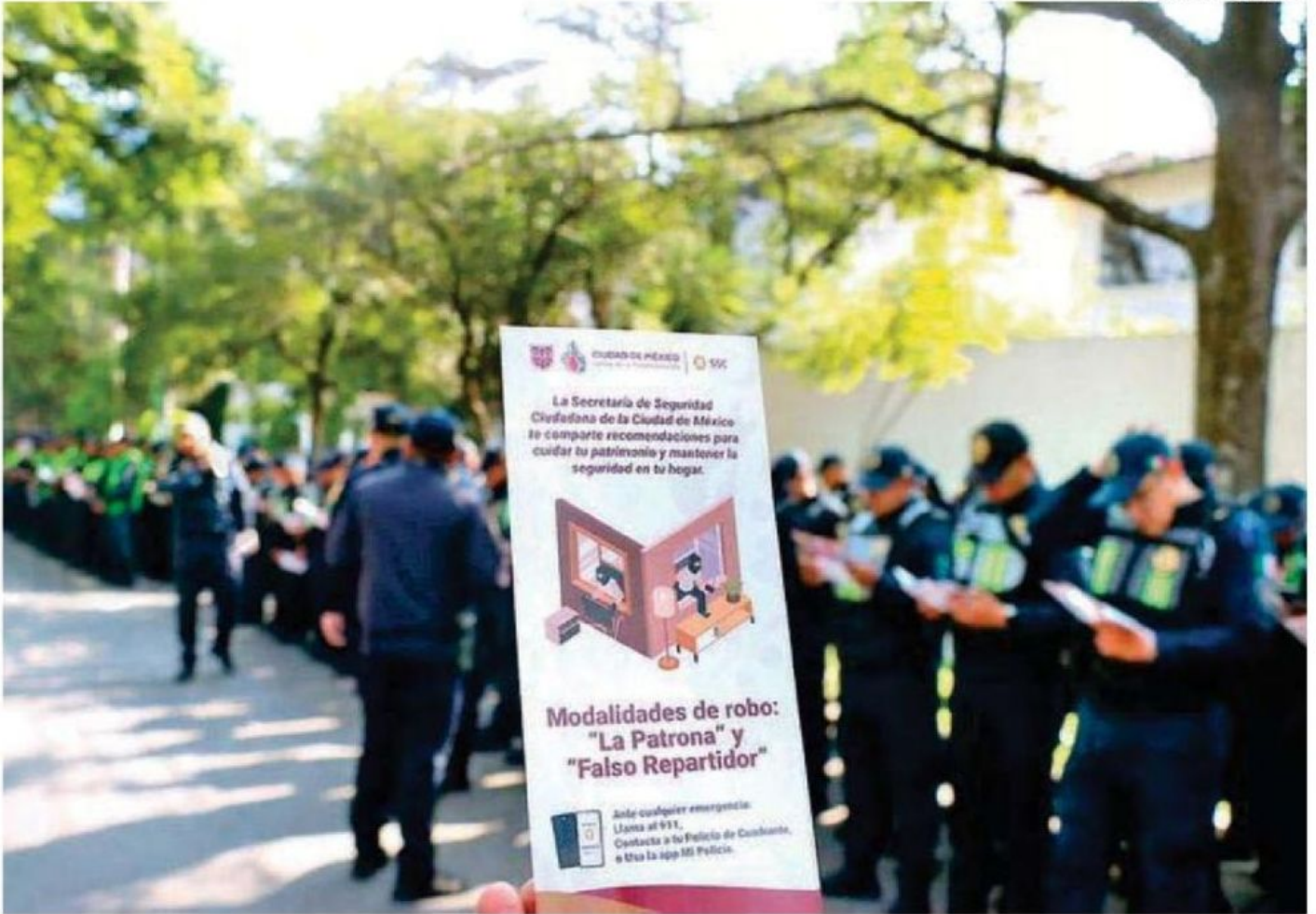
La SSC desplegó 500 policías y compartió recomendaciones para "mantener la seguridad en sus hogares"