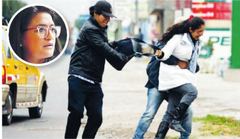
· Son los asaltos a transeúntes uno de los crímenes más comunes en esta alcaldía

En 2025, la SSC reportó una caída del 13 % en la incidencia delictiva general en Iztapalapa, gracias a estrategias de patrullaje, inteligencia, ampliación de cuadrantes y atención comunitaria.