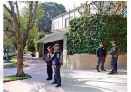
Arrancó dispositivo en Lomas Virreyes y Lomas de Chapultepec, donde los agentes realizaron visitas casa por casa para explicar el motivo de la movilización policíaca