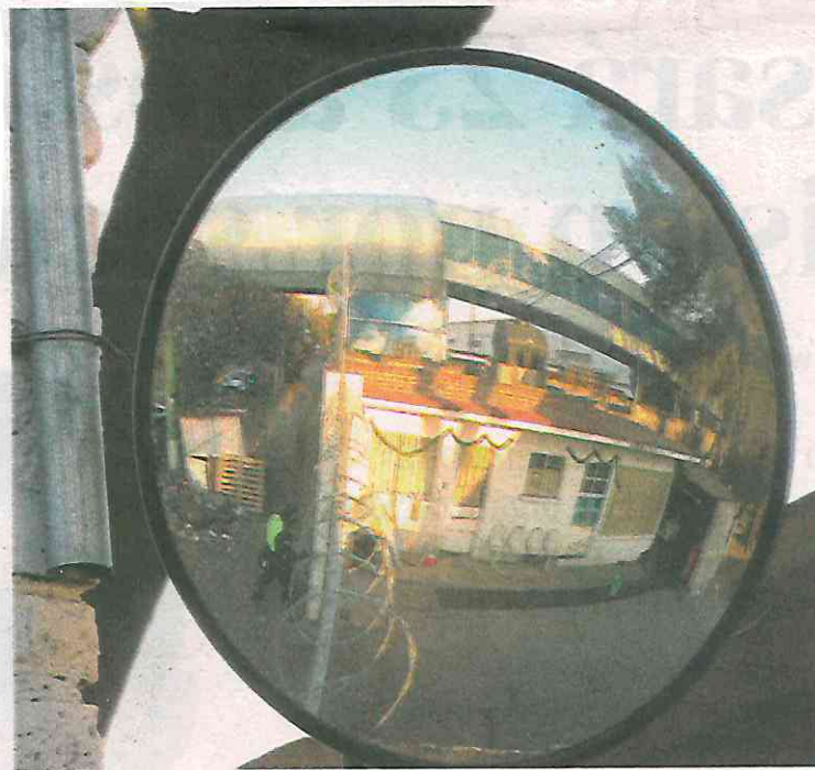
Un elemento sólo escuchó detonaciones y vio al guardia nacional herido mortalmente

teriales del IMSS, delegado por la Guardia Nacional, se encontraba la noche del sábado conversando con su pareja, sin embargo, la conversación se tornó problemática; aseguró un compañero que se encontraba con él.