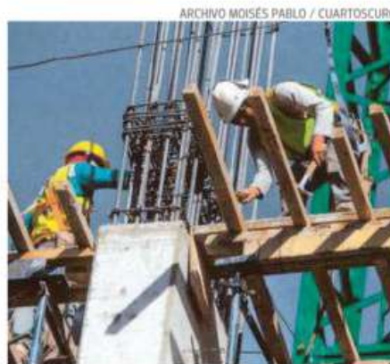
La construcción se concentró en 2017 y 2022

La construcción de pisos extras es una de las prácticas que pretende sancionar la Ley de Responsabilidad Ambiental de la Ciudad de México, cuya discusión está en