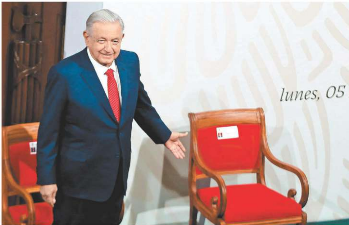
El Presidente expuso que el paquete enviado al Congreso busca quitar “todo sesgo neoliberal” a la Carta Magna. ARACELI LÓPEZ