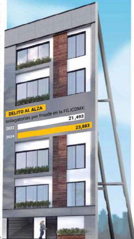
Ilustración: Abraham Cruz

ESTE DELITO MUESTRA UN INCREMENTO AL COMPARAR 2023 CON 2022; compradores y arrendadores de departamentos, entre los afectados