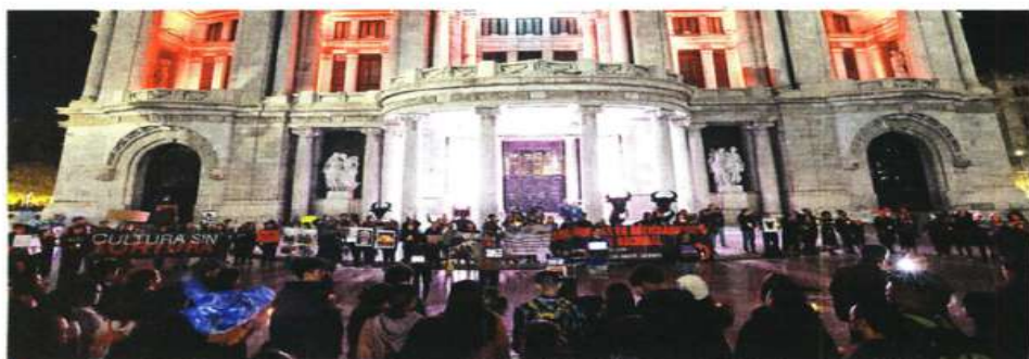
Decenas de manifestantes realizaron una velada afuera de Bellas Artes, piden a las autoridades frenar las corridas.

Estas candidaturas sin partido aparecerán en la boleta electoral junto con los partidos.