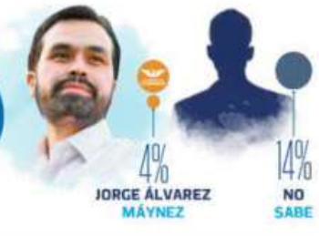
GRÁFICO: NELLY VEGA

NUEVA ERA / AÑO. 7 / NO. 2428 / MARTES 6 DE FEBRERO DE 2024