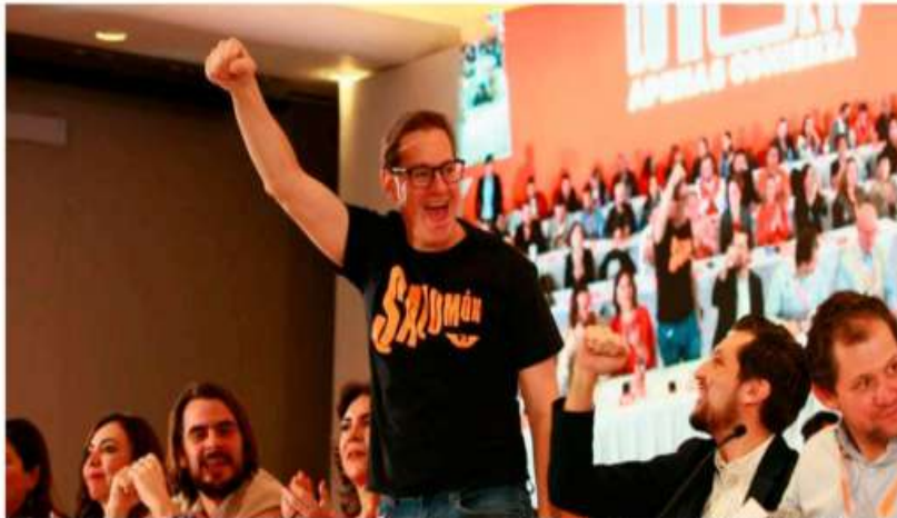
La Asamblea Electoral Nacional de MC aprobó la candidatura de Chertorivski como Jefe de Gobierno de la Ciudad de México

La Asamblea Electoral Nacional, como órgano máximo de decisión del partido, sometió a votación el proyecto de Chertorivski para la Jefatura de Gobierno de la Ciudad de México, obteniendo un respaldo positivo unánime. Este respaldo allana el camino para que Chertorivski inicie su campaña el primero de marzo, extendiéndola hasta finales