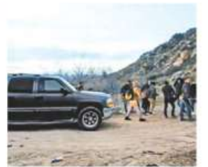
Servicio exclusivo. ESPECIAL

El candidato republicano llamó a su partido a rechazar el acuerdo de voto migratorio por ayuda para Ucrania. PAG. 13