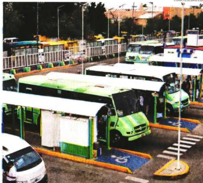
Las tarifas seguirán igual que hace 10 años

"El transporte es el programa social al que más le invertimos para beneficiar a millones de personas"