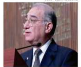
Ministro Alberto Pérez Dayán.