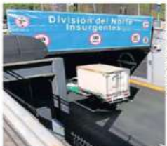
Viaducto es una vía de acceso restringido para vehículos de carga.

Según el actual reglamento de tránsito, las arterias con acceso restringido para vehículos pesados, de carga y de pasajeros son el Circuito Interior, Periférico y Viaducto. ●