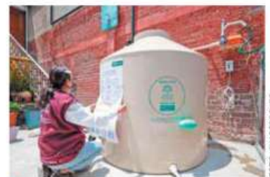
● UNIÓN. Destacan interés en el programa.

Y es que durante este año se instalarán 10 mil sistemas y Venustiano Carranza lleva mil 356 solicitudes, muy por encima de demarcaciones más grandes en población y territorio, a pesar de que en otras alcaldías hay también más problemas de abasto de agua. CINTHYA STETTIN