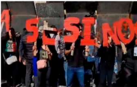
Los colectivos a favor del bienestar animal le solicitaron a las autoridades capitalinas que se detuviera de inmediato la tauromaquia en la metrópoli.

Bajo el grito de ¡asesinos! y ¡toros sí, policías no!, los inconformes bloquearon y realizaron pintas a los accesos de la plaza, sin embargo, éstos fueron encapsulados por elementos de la Secretaría de Seguridad Ciudadana