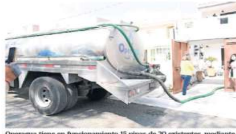
Operagua tiene en funcionamiento 15 pipas de 20 existentes, mediante las cuales reparten el líquido a las diferentes zonas.

Al igual que lo hicieron en los municipios de Tlalnepanitla y Naucalpan, Valdés Rodríguez sostuvo que es importante la declaratoria de emergencia nacional para poder emplear el dinero que de ello se desprenda en obras de infraestructura hidráulica y llevar el agua a las colonias, toda vez que actualmente se emplean todos los recursos propios posibles, pero resultarían insuficientes. ●