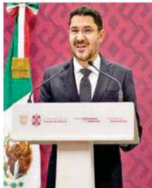
El jefe de Gobierno, Martí Batres, en conferencia de prensa