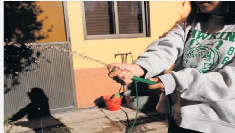
La última disminución en el suministro del Sistema Cutzamala para el Estado de México representó una baja de hasta 50% del afluente para 14 municipios del Estado de México, entre ellos, Toluca, Naucalpan, Huixquilucan y Tlalnepanitla.

Municipios mexicanos aprovecharon los Bandos Municipales, que se publicaron este 5 de Febrero, para sancionar a habitantes que desperdician el agua, de acuerdo con un sondeo realizado por EL UNIVERSAL.