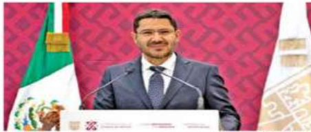
El jefe de Gobierno, Martín Batres, se refirió a las corridas de toros ayer durante una conferencia de prensa.