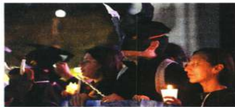
En algunos puntos, los activistas prendieron veladoras mientras eran rodeados por policías antimotines.

En tanto, en Bellas Artes, durante la noche prendieron veladoras para que las autoridades detengan lo que consideraron maltrato animal en el ruedo. "En homenaje a los toros que han caído desde la primer corrida, invitamos a la gente para hacer consciencia de la matanza, de la tortura