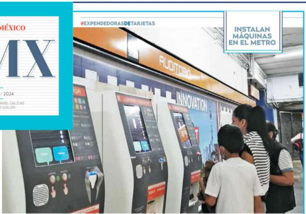
INSTALAN MÁQUINAS EN EL METRO

● El Metro informó que finalizó la instalación de 92 nuevas máquinas para expedir tarjetas de prepago y recarga. Se suman a las 314 existentes en 34 estaciones de las Líneas 1, 2, 3, 7, 8, 9, 12 y B. CINTHYA STETTIN