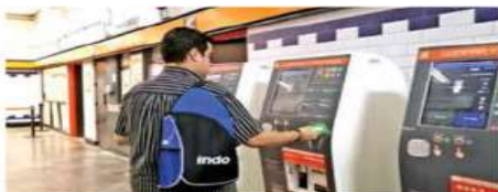
Las nuevas expendedoras están en la última fase de configuración y su entrada en funcionamiento está próxima.

El pasado 26 de enero la asociación Todas y Todos por Amor a los Toros presentó un juicio de amparo ante el Poder Judicial de la Federación para combatir artículos de leyes locales que permiten las corridas de toros, por considerar que van contra la Constitución de la ciudad.