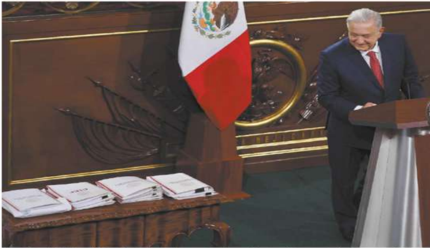
El presidente Andrés Manuel López Obrador observa las carpetas en las que plasmó sus 20 propuestas de reforma para echar atrás lo aprobado en los gobiernos neoliberales y que presentó ayer en el Recinto Parlamentario ubicado en Palacio Nacional.