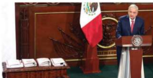
EL PRESIDENTE, ayer al presentar las iniciativas en Palacio Nacional.

Propone fondo semilla por generarse de ventas y dependencias para pagar pensiones al 100% págs. 3 a 6