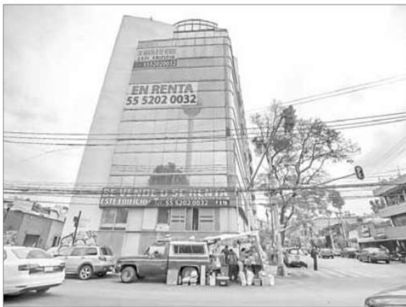
▲ Pese a que el edificio está involucrado en una carpeta de investigación por lesiones en agravio de dos adultas mayores, se colocó un letrero de "se