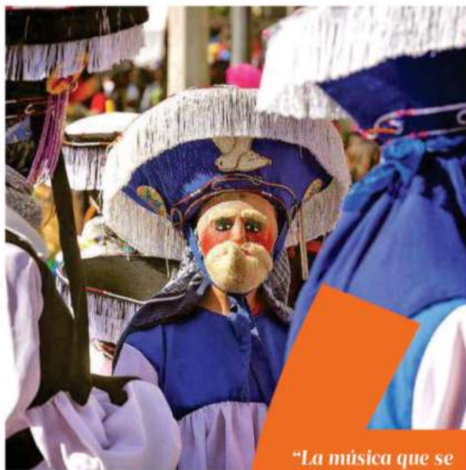
Planean hacer el desfile de manera permanente

"Se trata de un sincretismo cultural pero con una raíz indígena muy fuerte, de hecho la música que se toca tiene una raíz indígena fuerte y están asentados precisamente en los pueblos originarios, ya decía yo que es una forma de protesta de burla de los ri-