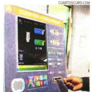
Continúa la renovación en la red