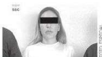
Era una chucha cuerera