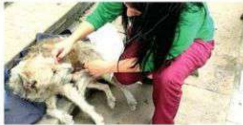
· Penas ascienden hasta 10 años de prisión

· La alcaldía Cuauhtémoc lidera con 52 eventos de maltrato