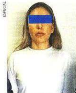
La rubia había sido detenida el pasado 13 de enero de 2022.

Fue gracias a diversas denuncias de robo, en las se destacaba el mismo modus operandi, que los policías mediante un operativo lograron detener a la mujer de 28 años, quien es integrante de una banda en la que participan al menos seis personas. Tenía en su poder un arma corta, hierba verde, un teléfono celular de alta gama, dos barreras de metal y dos placas de circulación.