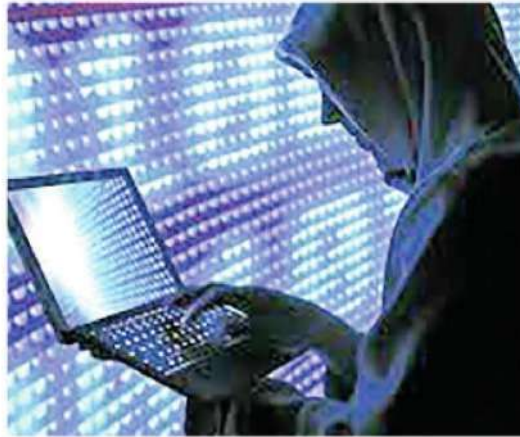
Atendieron a mil 206 ciudadanos