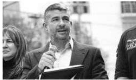
El edil implementó el programa Blindar MH

“La seguridad es responsabilidad principal del gobierno de la ciudad, pero no es casualidad que las alcaldías de oposición sean las que tienen mejores cifras de seguridad”