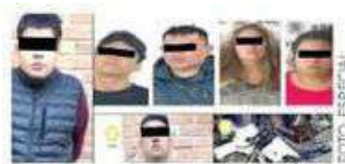
Ya están presos

Enganchaban a sus víctimas con atractivas ofertas.