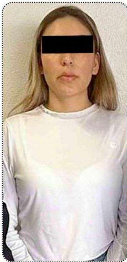
Mujer detenida, vinculada con robo a casas habitación