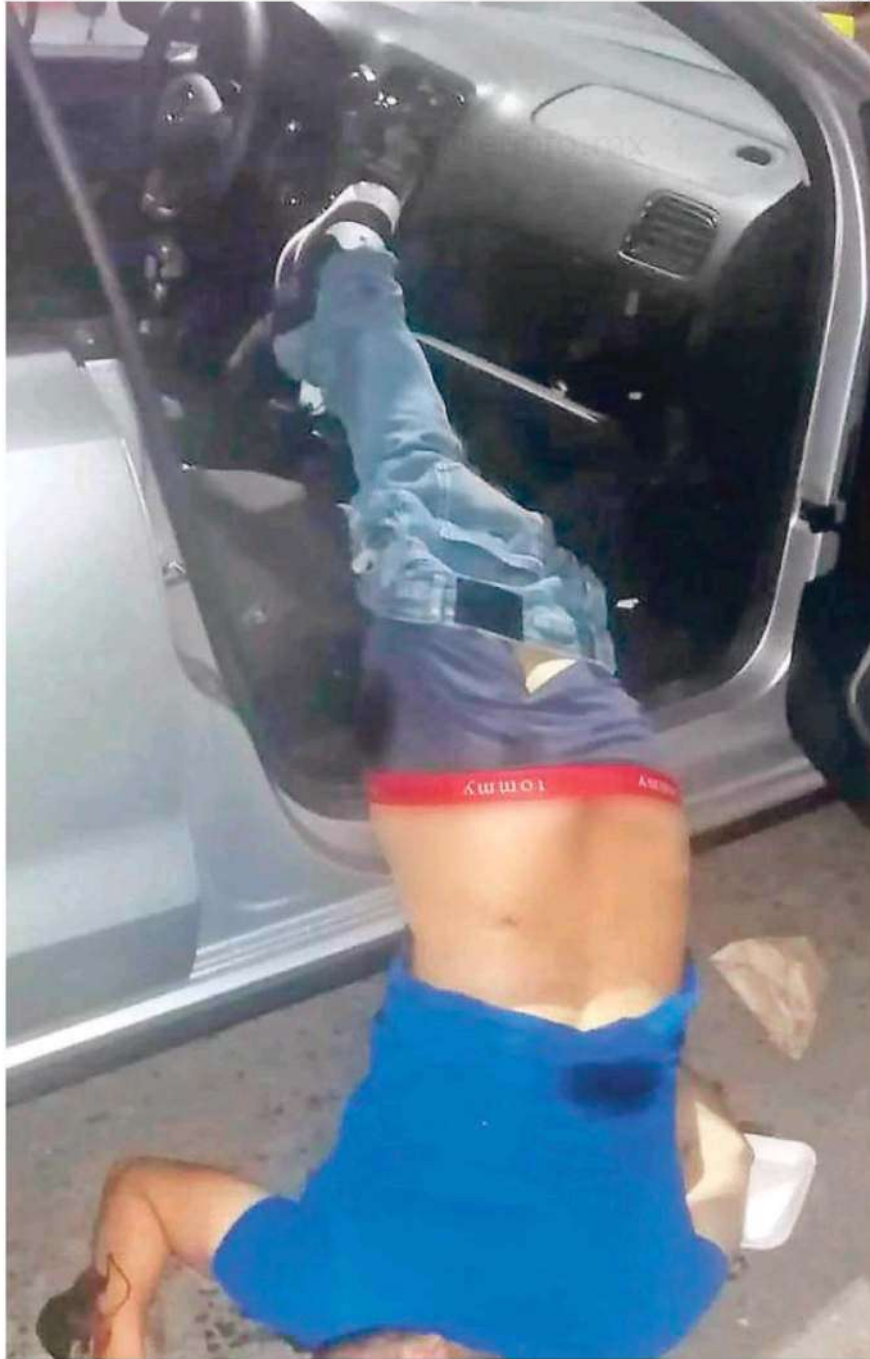
El hombre trató de salir del carro, sin embargo, solo alcanzó a abrir la puerta