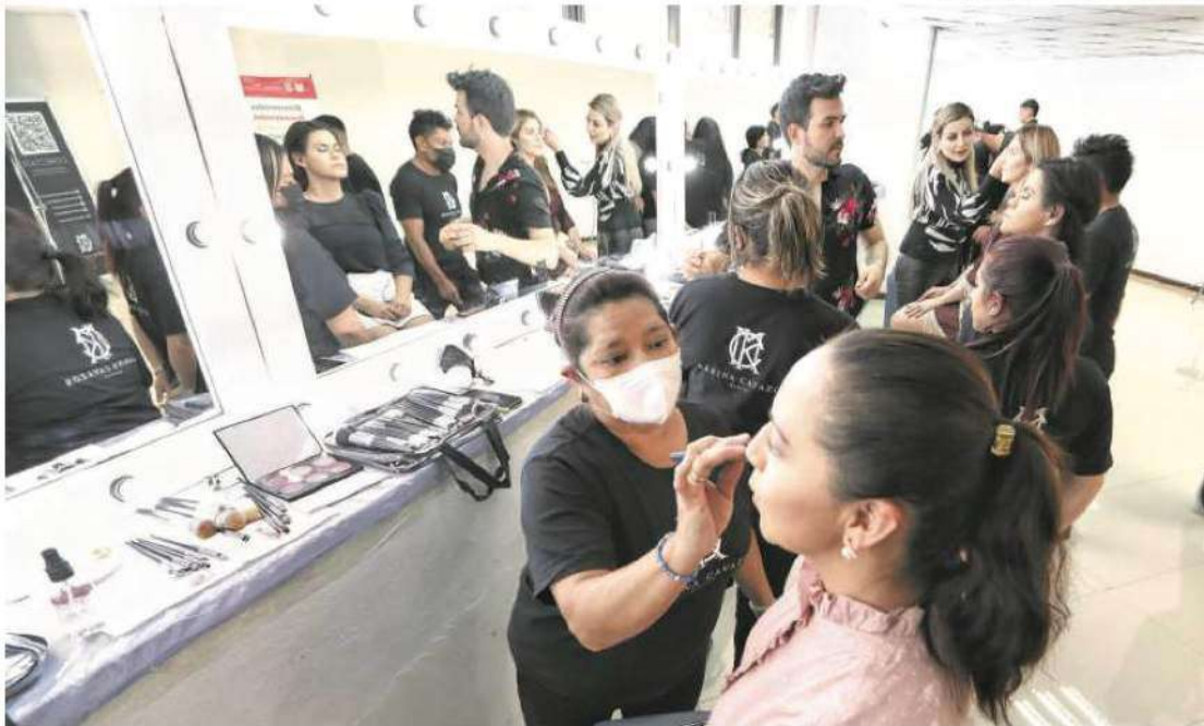
La primera generación de maquillistas está conformada por 18 mujeres y dos hombres