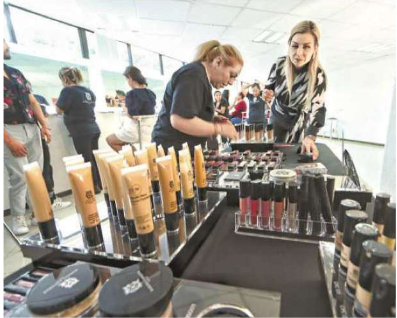
Ellas podrán capacitar a las siguientes generaciones del instituto