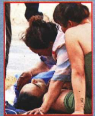
Familiares abrazaron al occiso.

Cuando los agentes de la Policía de Investigación entrevistaron a la esposa del occiso, la mujer explicó que desconocía el motivo de la agresión, pues su marido no tenía problemas con ninguna persona.