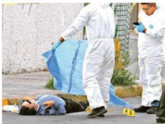
La esposa del finado se presentó en el lugar, burló la cinta amarilla y se acercó para reconocer el cuerpo entre llanto y lamentos.