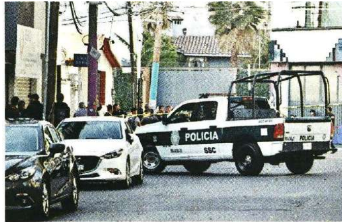
El hombre fue ejecutado por tripulantes de una moto.

Según testimonios de vecinos de la Colonia, últimamente se ha vuelto insegura, principalmente por robos y asaltos, aunque no habían escuchado de ataques directos en la zona.