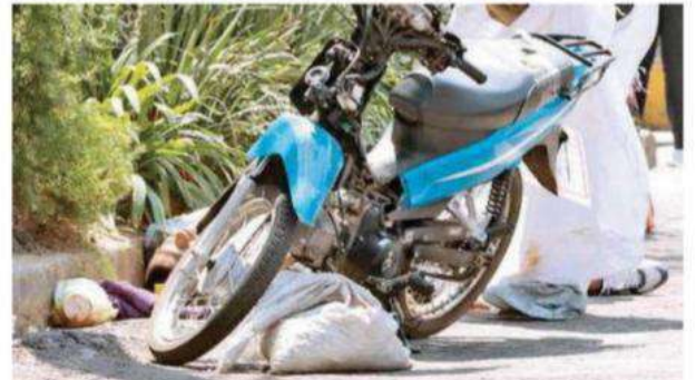
Los hechos ocurrieron en la calle Chichimecas casi esquina con Moctezuma, colonia Ajusco