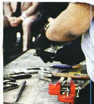
La SSC recibirá un certificado para avalar la destrucción de los equipos decomisados en penales.