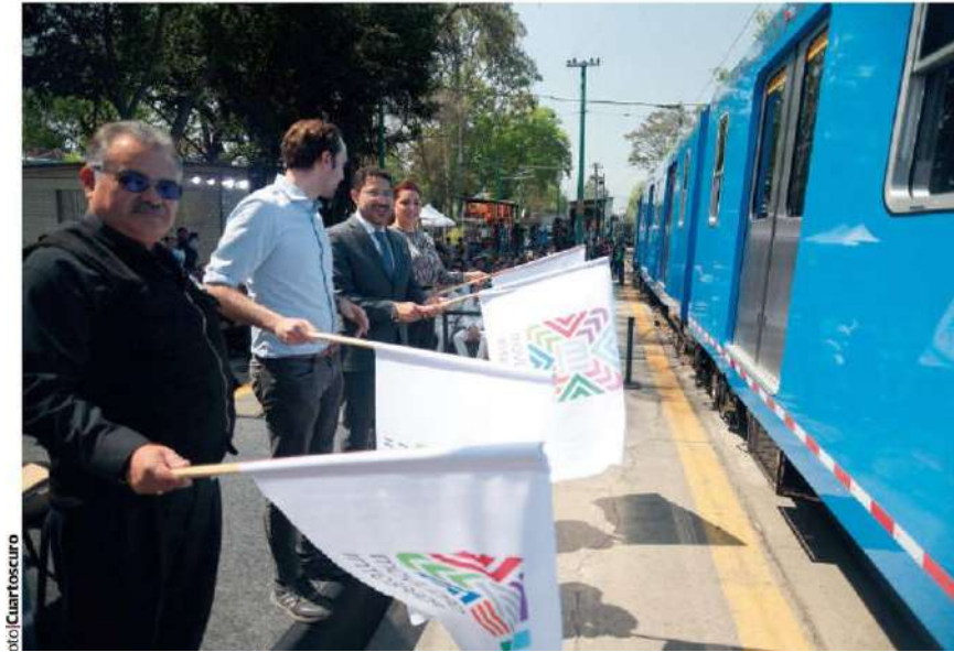
BANDERAZO de salida de dos nuevos trenes ligeros, ayer.