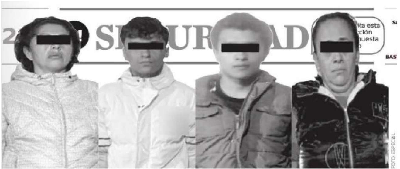
Querían reverdecer el Cártel de Neza