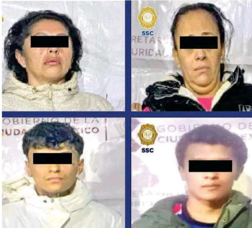
Junto con Gabriela fueron detenidos cuatro de sus principales colaboradores, los cuales se encuentran ya a disposición de un juez y en las próximas horas se determinará si son vinculados a proceso