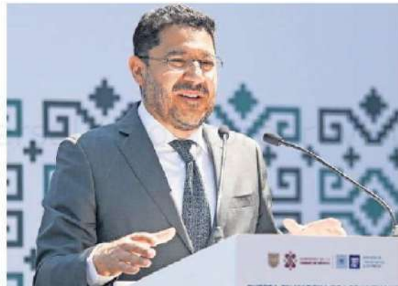
Martí Batres dijo que este lunes pidió a funcionarios definir el protocolo de protección para los candidatos.

En entrevista con EL UNIVERSAL, el secretario destacó que se ha planteado la posibilidad de brindar seguridad a los aspirantes que contendrán para cargos públicos, así como en los eventos que se organizarán en estos meses, sin que a la fecha algún candidato o candidata haya solicitado directamente algún tipo de seguridad. ●