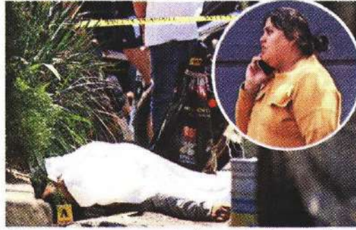
El occiso era herrero y conducía para 'apps' como Uber.