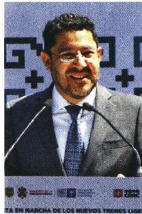
El Jefe de Gobierno indicó que el protocolo está terminado.

A nivel nacional, la SSPC informó que hasta el lunes se recibieron 23 solicitudes de protección.