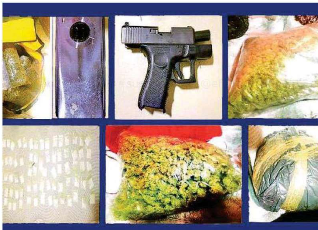
Durante los operativos y cateos se aseguraron dosis de posible cocaína y aparente marihuana, así como armas y un celular