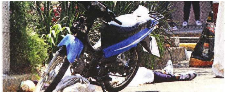
IVÁN MONTAÑO, EL GRÁFICO

Según vecinos, los atacantes, con quien la víctima tenía problemas, viven en una calle aledaña. Su esposa fue llevada al MP.