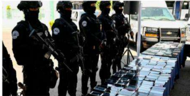
Elementos de la SSC presentaron los celulares asegurados.

La Secretaría de Seguridad Ciudadana (SSC) de la Ciudad de México ha llevado a cabo operativos constantes preventivos en aduanas y centros de reclusión, resultando en el aseguramiento de más de 6 mil teléfonos celulares y 269 SIMs en poco más de dos años. Este esfuerzo operativo busca evitar la comunicación ilegal desde las prisiones, utilizando métodos como la Unidad Canina (K9) del Sistema Penitenciario