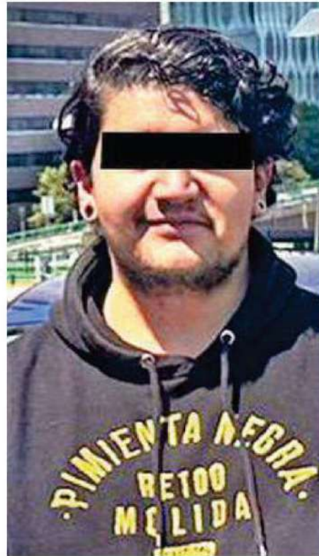
El hombre no pudo comprobar la procedencia del dinero

Por lo anterior, el hombre de 20 años de edad fue detenido, informado de sus derechos de ley y fue presentado, junto con el dinero asegurado, ante el agente del Ministerio Público correspondiente, quien definirá su situación jurídica.