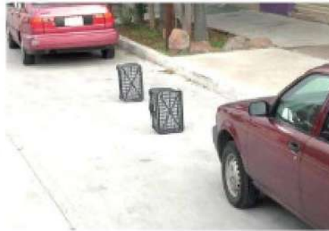
Obstruyen vialidades y amenazan a vecinos

- Las multas oscilan entre los 1,195 y 4,350 pesos, así como el arresto por hasta 24 horas