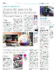
En la habitación número 21 ocurrió el homicidio