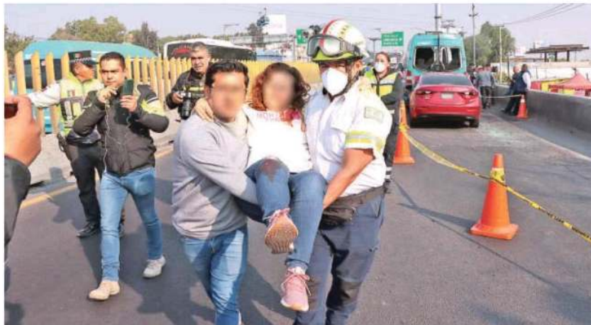
Cinco pasajeros de la Urvan y el copiloto del coche resultaron lesionados