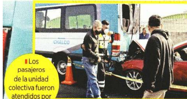
Los pasajeros de la unidad colectiva fueron atendidos por golpes.

Posteriormente, los vehículos fueron removidos del lugar.