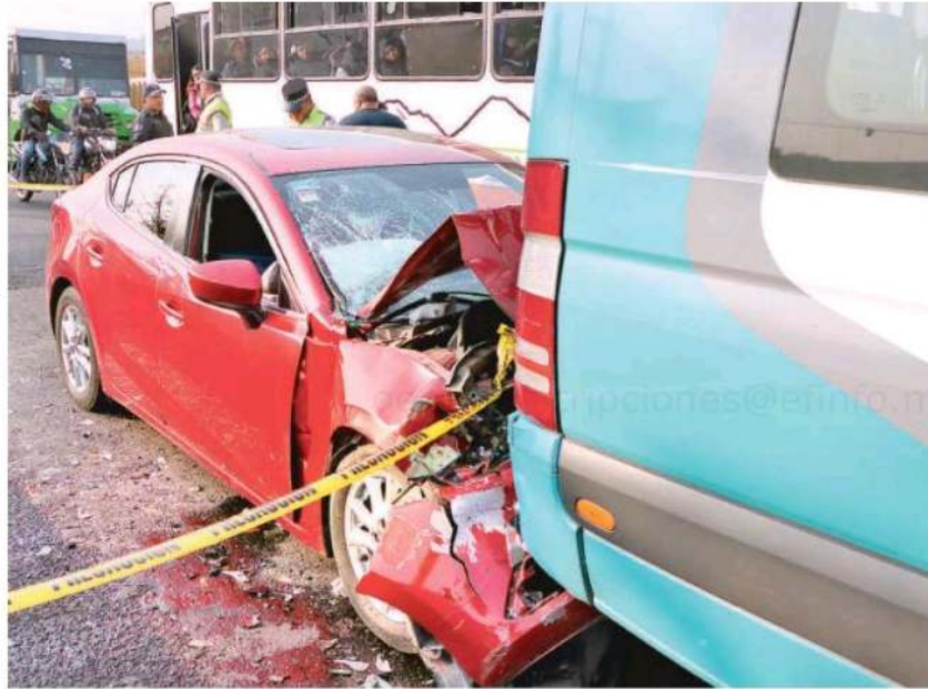
El choque por alcance ocurrió a la altura de la colonia Santa Martha Acatitla, donde el conductor del auto murió